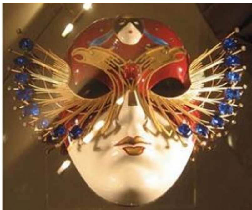
Эмблема театрального фестиваля «Золотая маска»