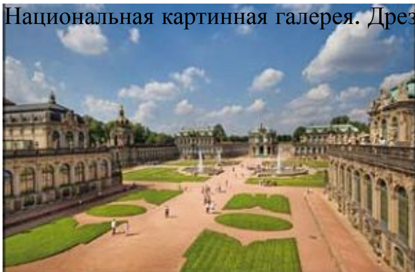
Национальная картинная галерея. Дрезден