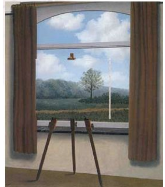
Р. Магритт. Человеческий удел