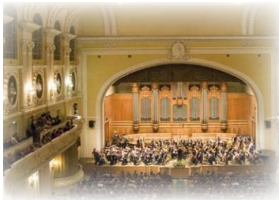
Международный конкурс имени П. И. Чайковского