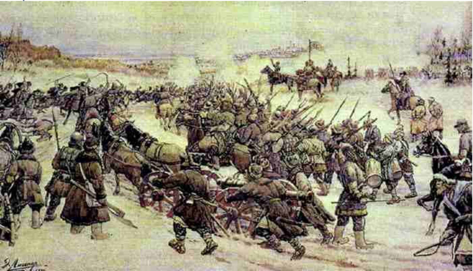
Лиснер Э. Восстание Болотникова