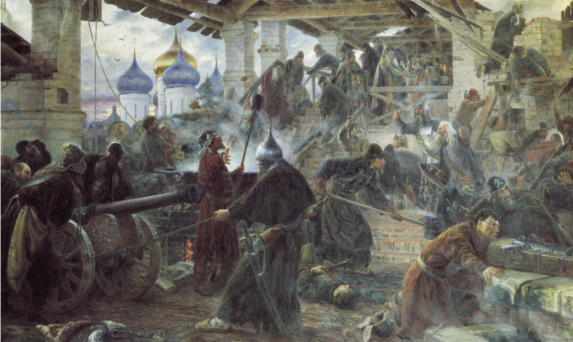
Военачальник Сапега осадил Троице-Сергиеву монастырь (1,5г)