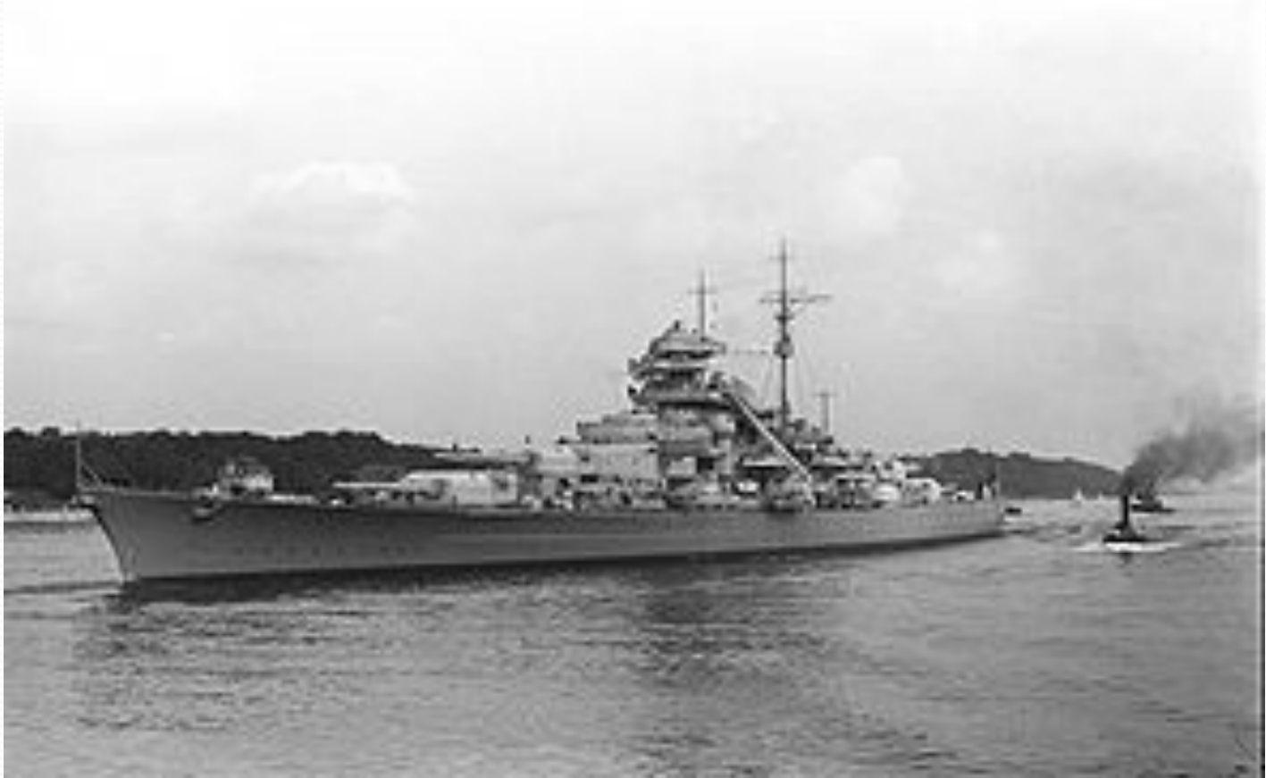
Линкор «Бисмарк», 1940 год