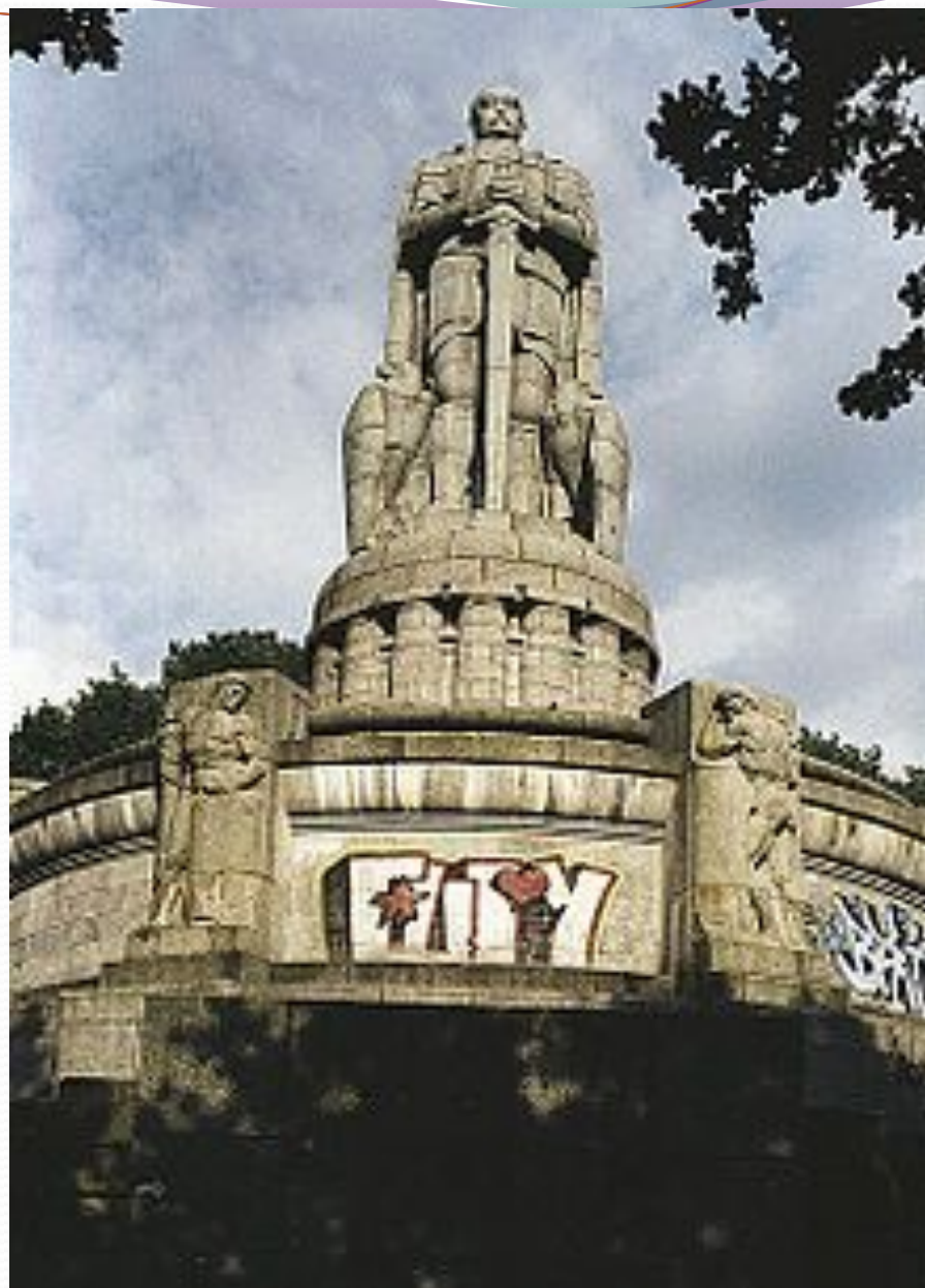
Памятник Бисмарку в Гамбурге.