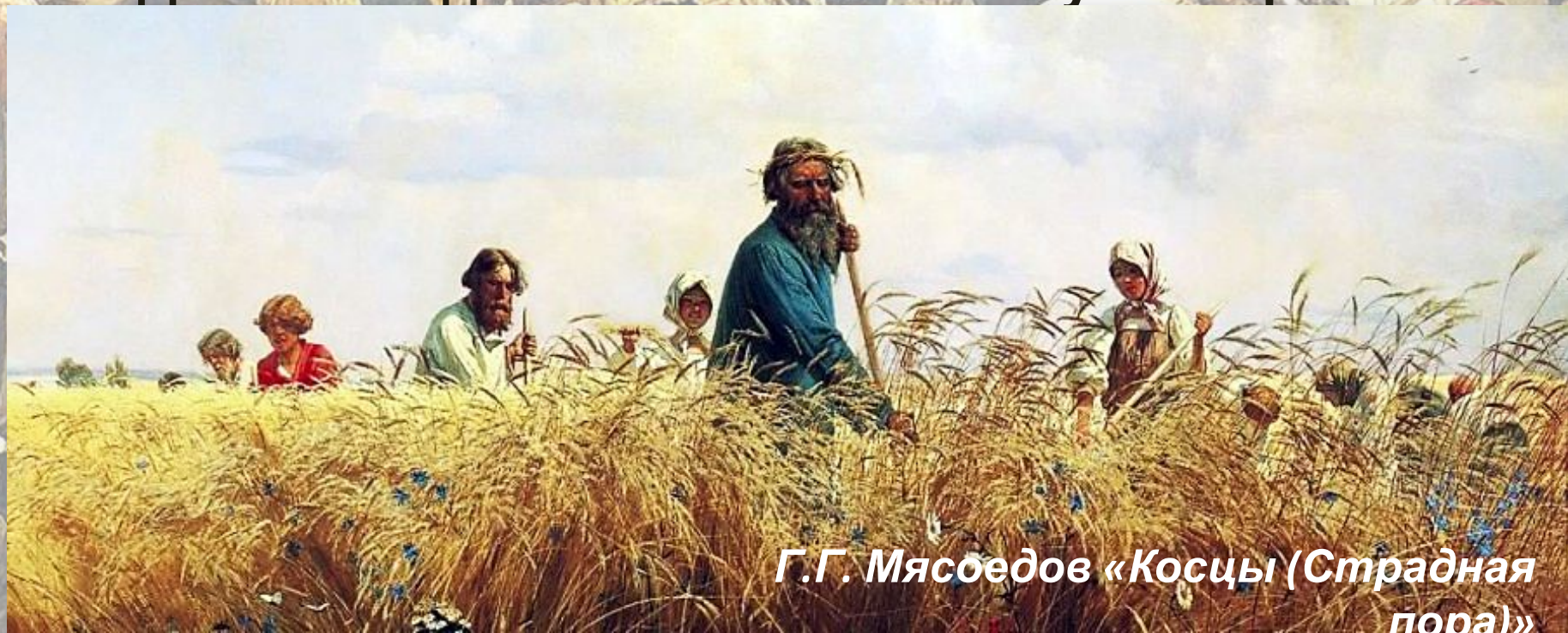
Г.Г. Мясоедов «Косцы (Страдная пора)»

В избе жила крестьянская семья, состоящая из 6—8 человек. В крестьянском хозяйстве трудились и мужчины и женщины. Женились рано — до 20 лет (в одиночку невозможно было вести хозяйство). Средний срок жизни крестьянина составлял 30—40 лет. Доживший до 45—50 лет считался уже стариком..