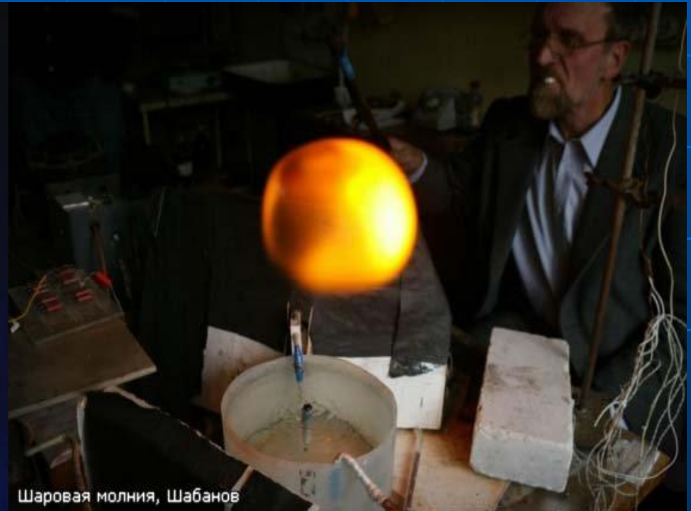
Шаровая молния, Шабанов