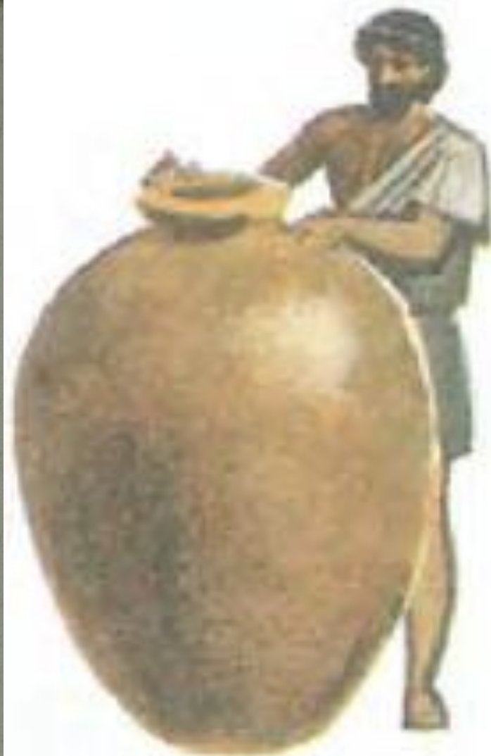
Пифос — глиняная бочка для хранения зерна.