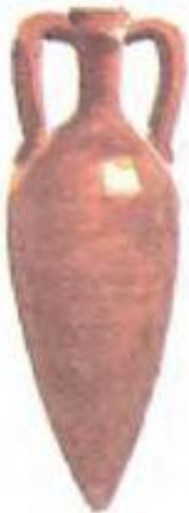
Амфора — сосуд для вина и масла.