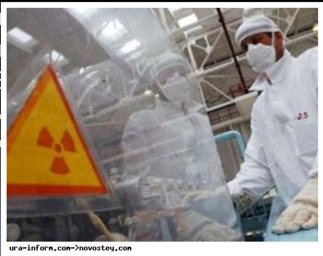
ura-inform.com → novostey.com