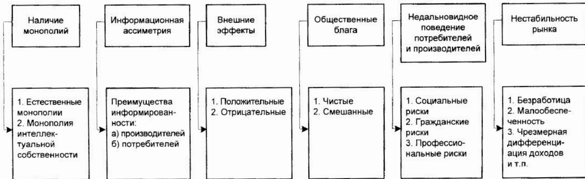
Рис. 1.3. Виды провалов рынка