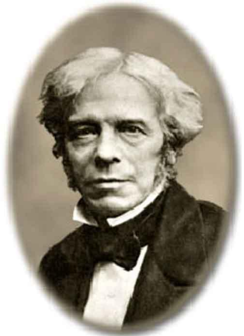
Michael Faraday (1791-1867)