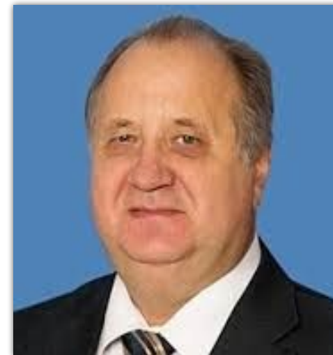
Кондрашин Виктор Викторович

Член Совета Федерации Федерального Собрания РФ - представитель от Правительства Пензенской области