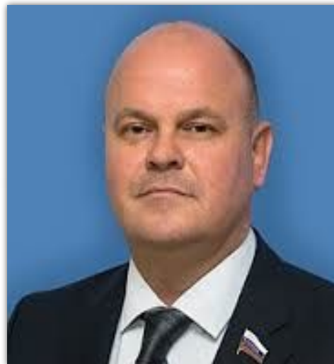
Дмитриенко Алексей Геннадьевич

Член Совета Федерации Федерального Собрания РФ - представитель от Правительства Пензенской области