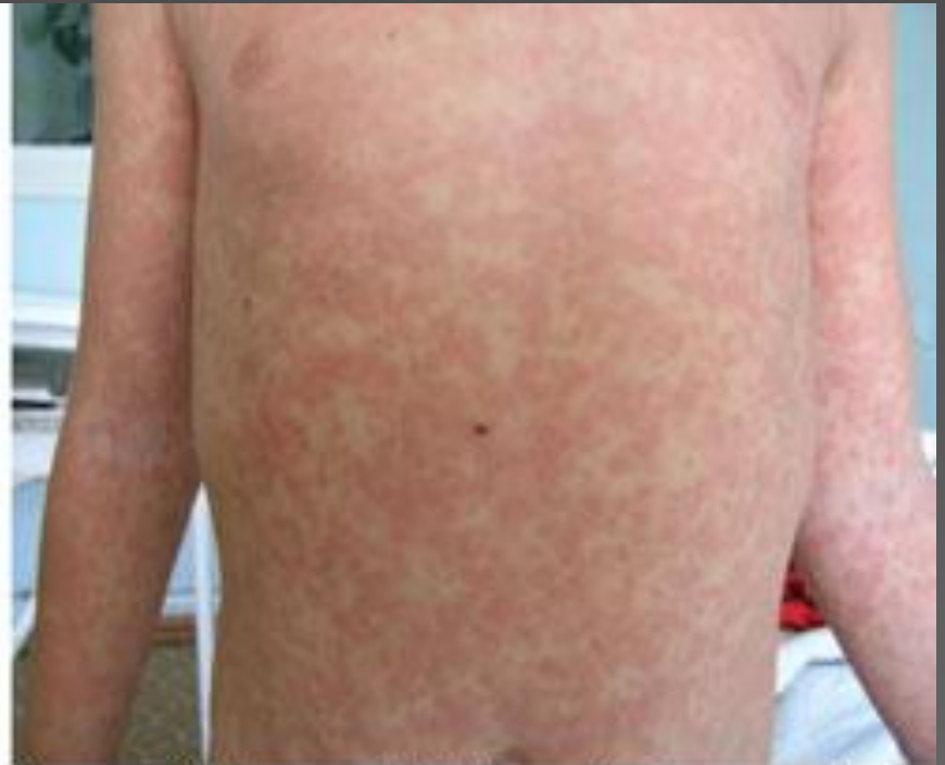
Рисунок 2. Пациент М., 11 лет. Инфекционный мононуклеоз, токсико-аллергический дерматит