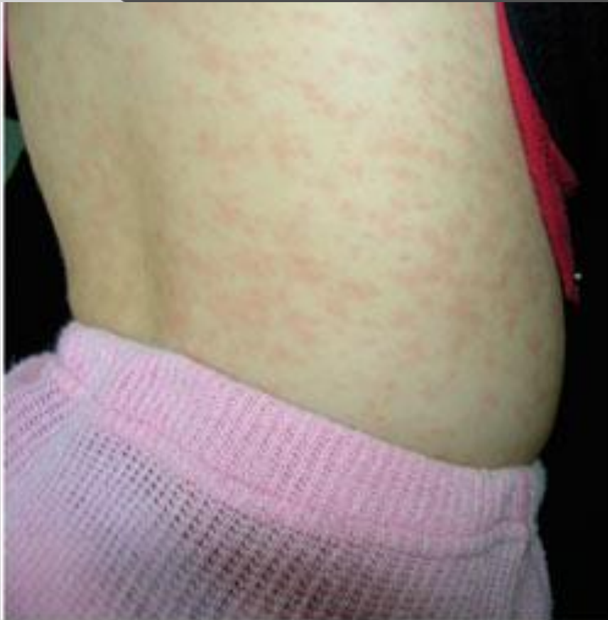
Рисунок 1. Пациентка М., 4 года. Корь, второй день высыпания