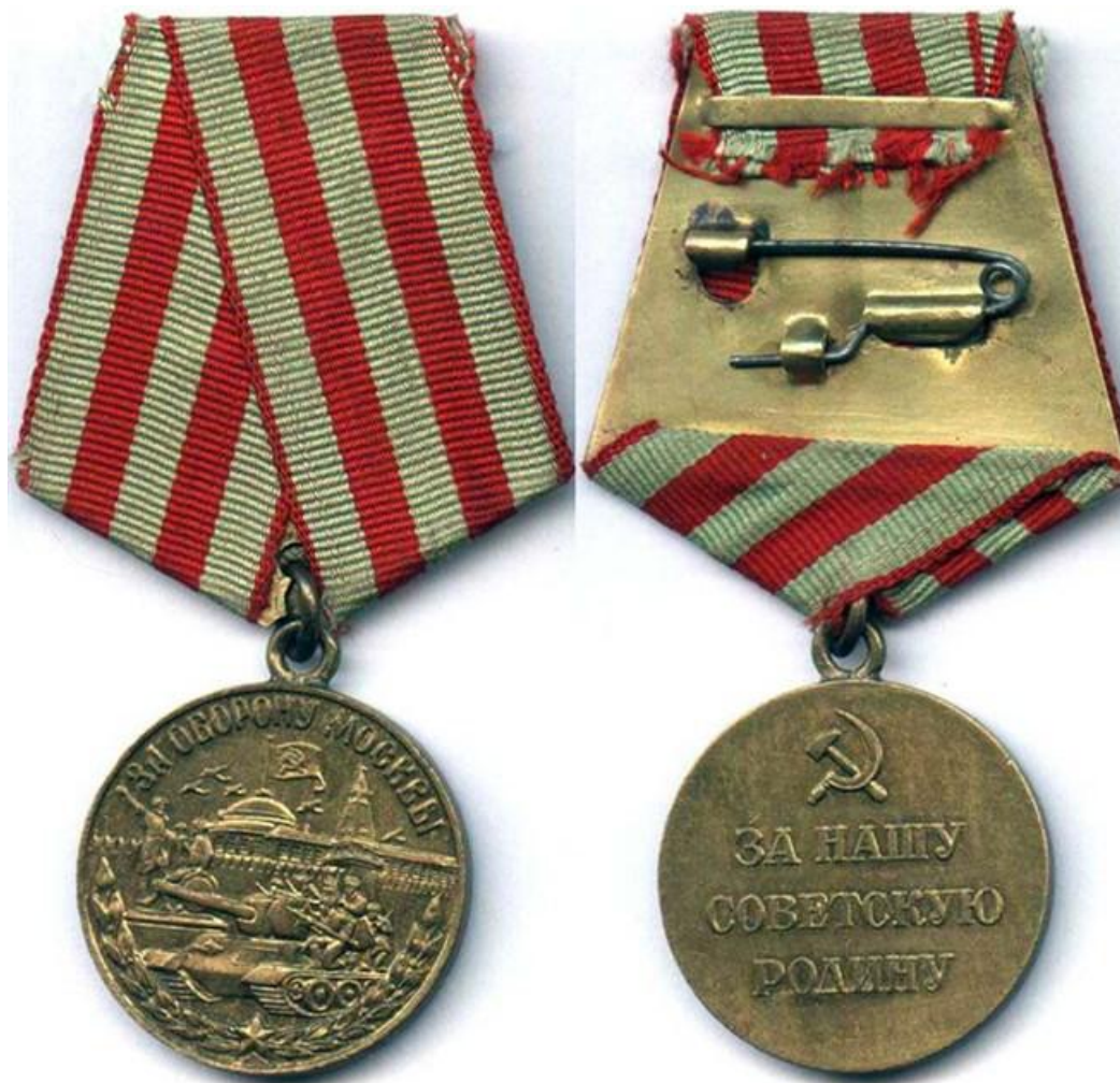
Медаль «За оборону Москвы»