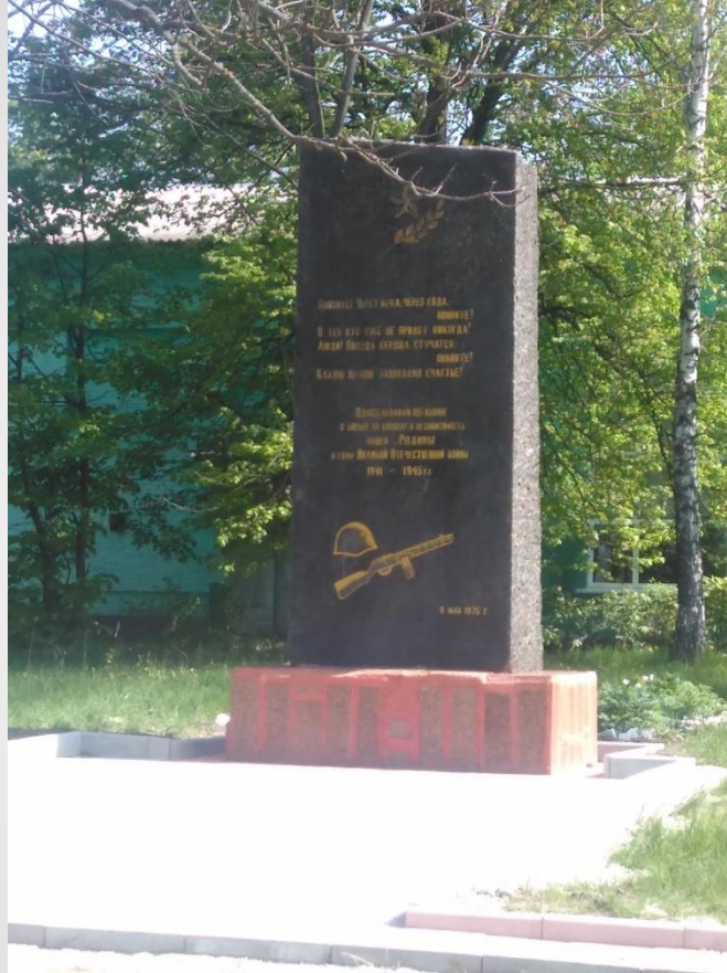
Пам'ятник загиблим солдатам