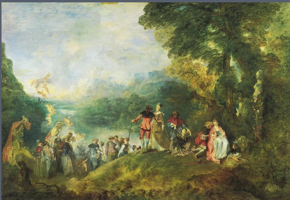
«Отплытие на остров Киферу» (1717 г.)