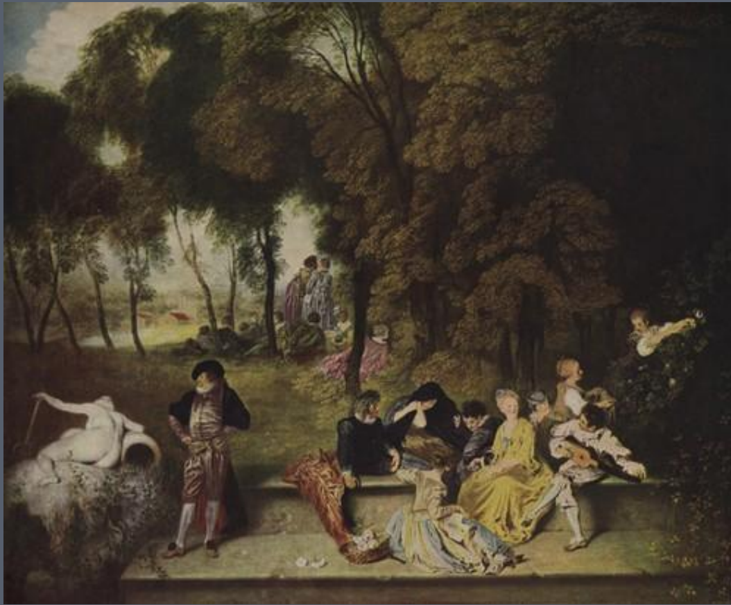
«Общество в парке» (1717—1718 гг.)