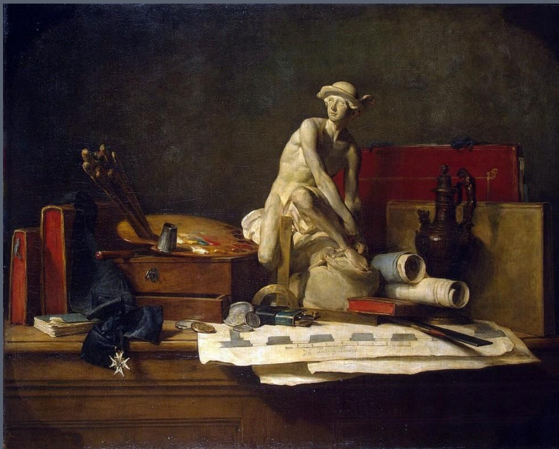
Натюрморт с атрибутами искусств. 1766 г.