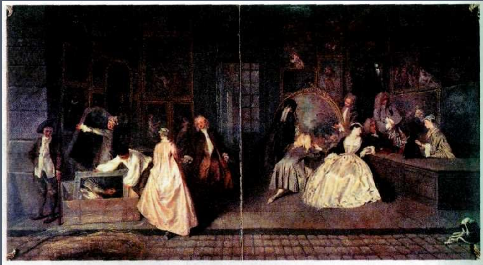
Вывеска лавки Жерсена. 1720 г.