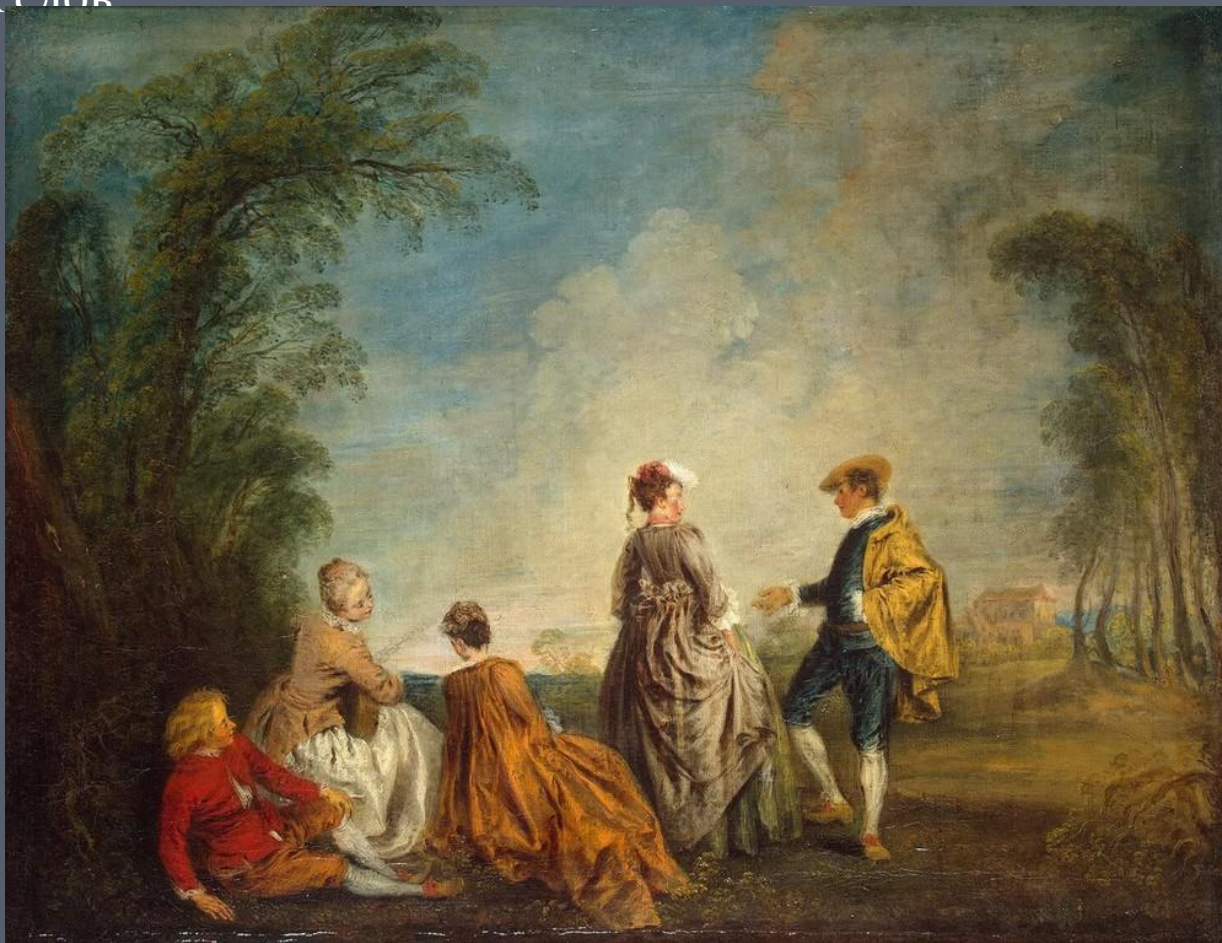
«Затруднительное предложение» (1716 г.)