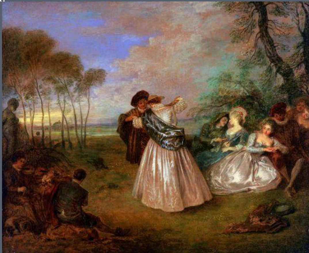
Общество на открытом воздухе (1716)