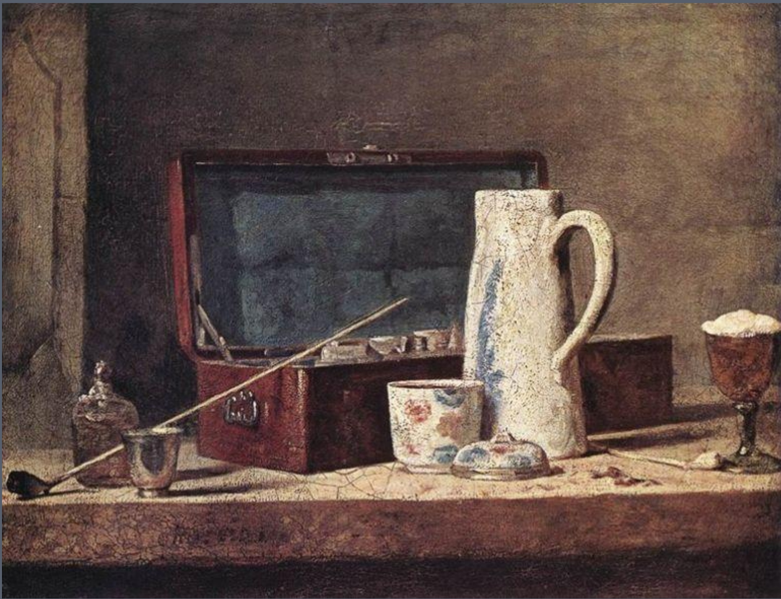
«Трубки и кувшин», 1766 г.