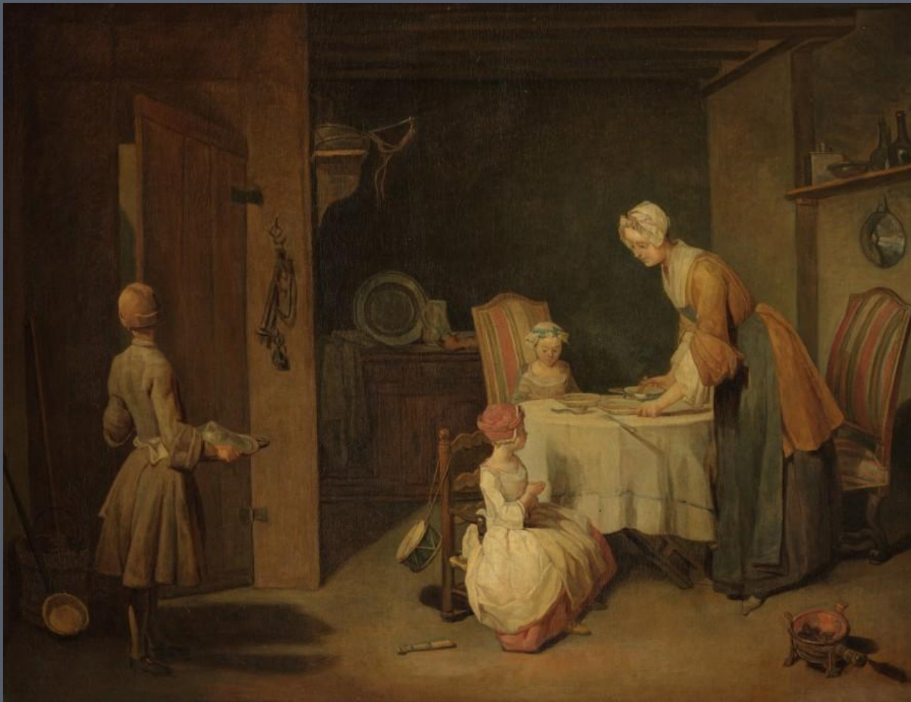
«Молитва перед обедом» (1744 г.)