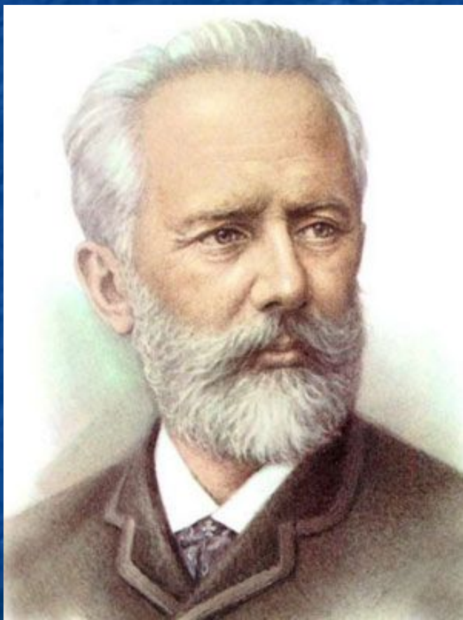
П. И. Чайковский