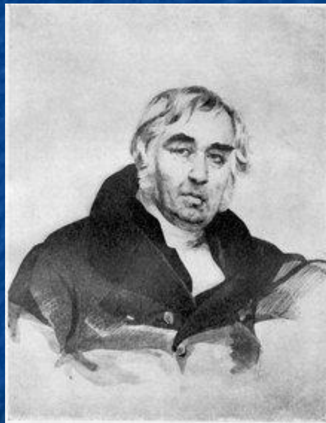
И. А. Крылов