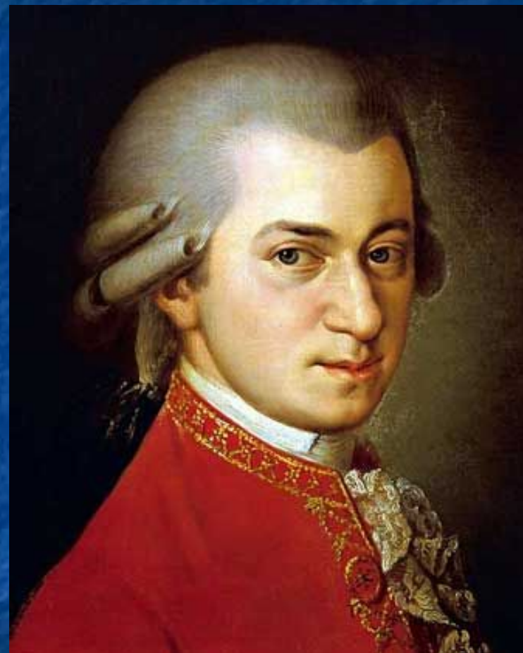
В. А. Моцарт