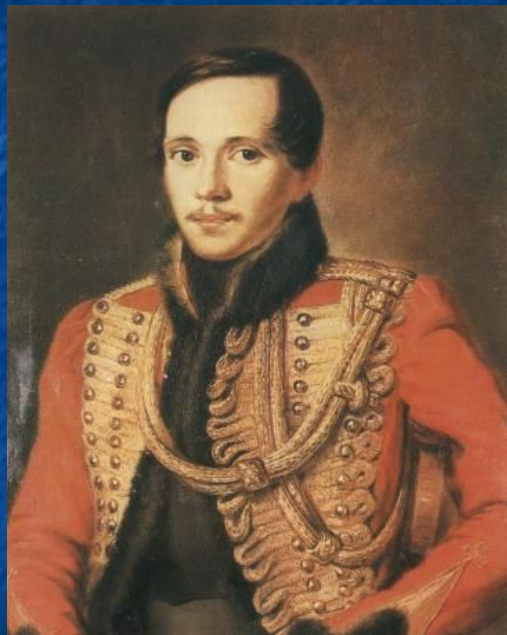
М. Ю. Лермонтов