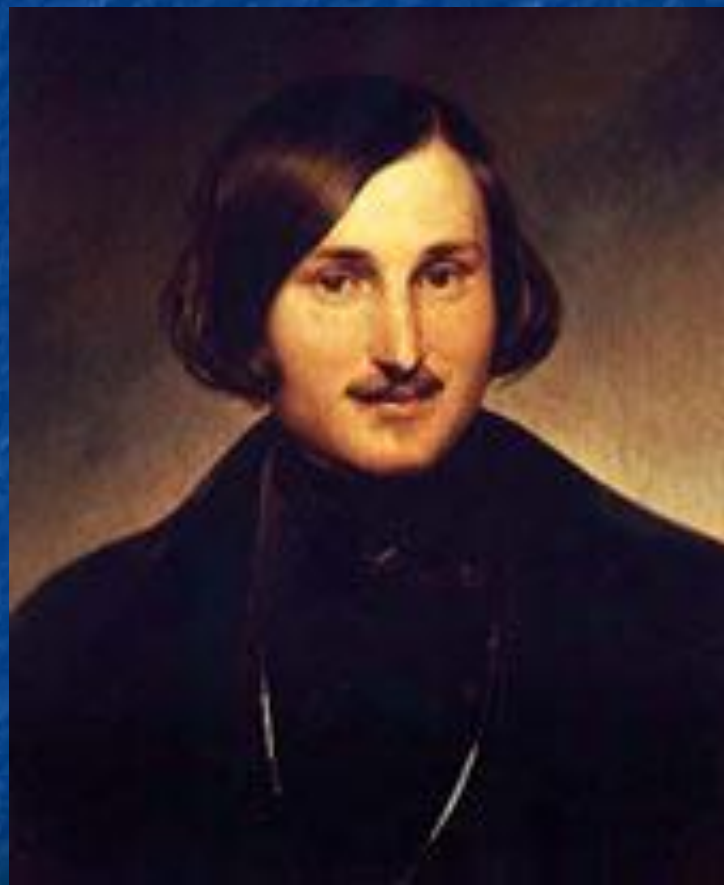
Н. В Гоголь