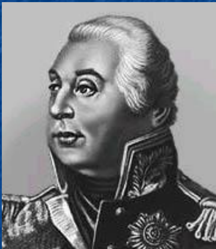
М. И. Кутузов