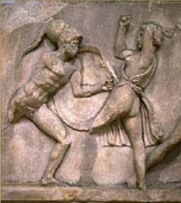
Битва греков с амазонками.

Деталь рельефа из Галикарнасского Мавзолея.