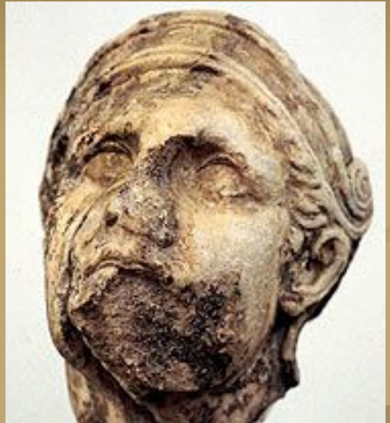
Голова раненого воина.

Деталь рельефа из Галикарнасского Мавзолея.