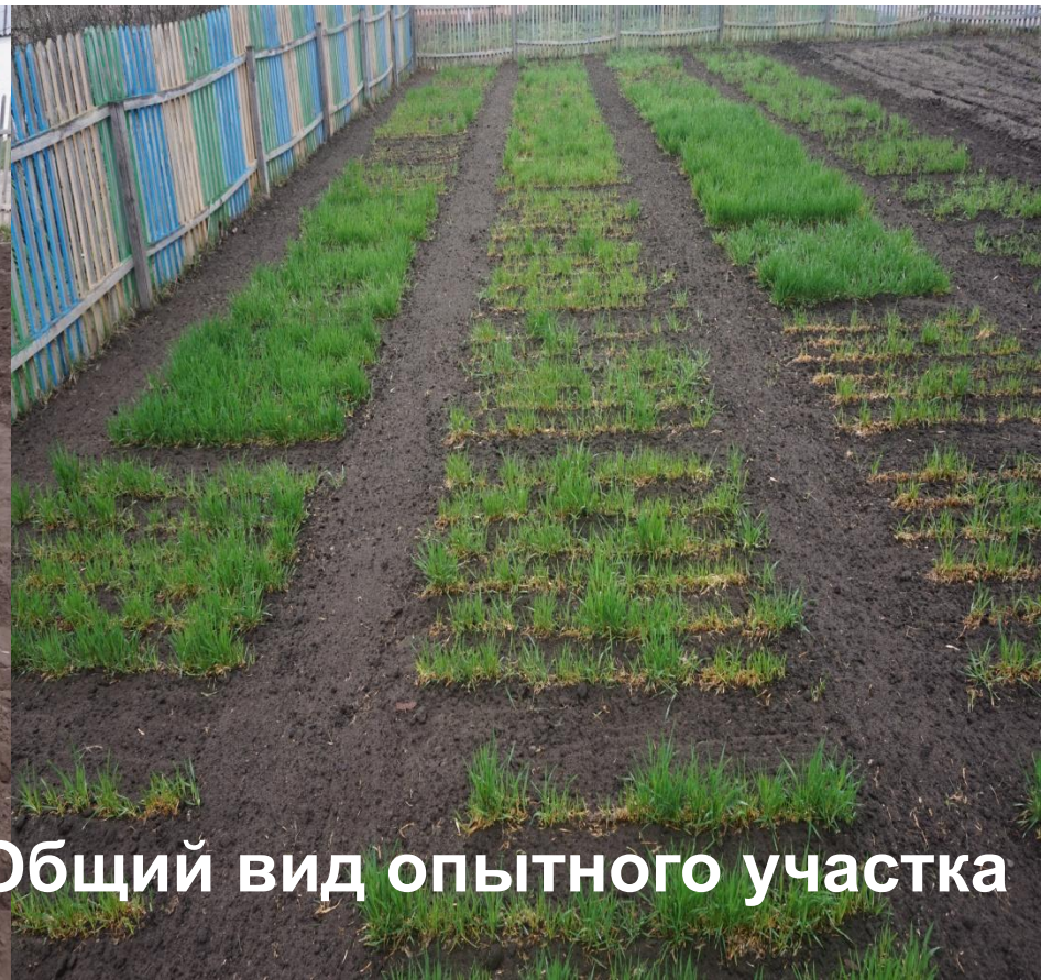
Общий вид опытного участка