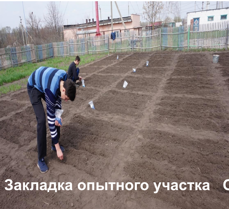
Закладка опытного участка