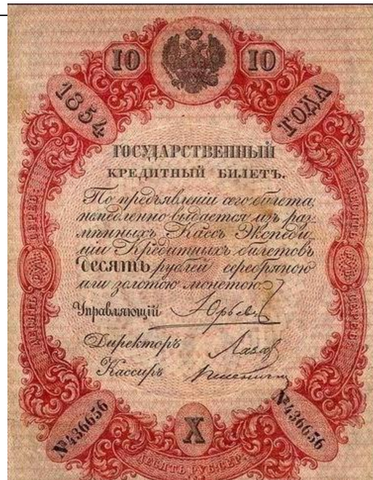
Государственный кредитный билет 1854