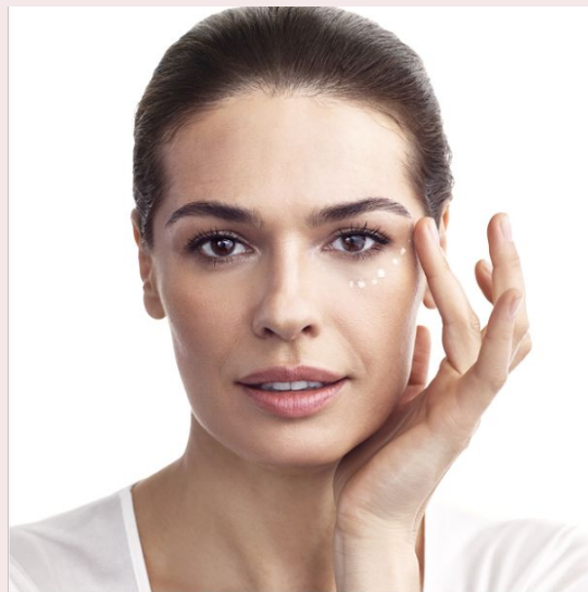
ШАГ 2: ГЛАЗА Фокус на коже вокруг глаз