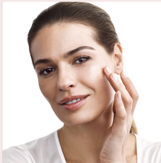
ШАГ 3: АКТИВАТОР Активируйте силу молодости