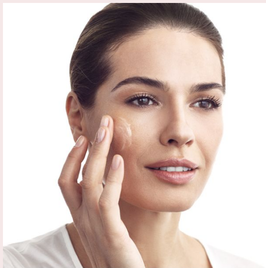
ШАГ 1: ОЧИЩЕНИЕ Подготовка к нанесению ухаживающих средств

4 простых шага, которые сделают кожу лучше в 7 раз!*