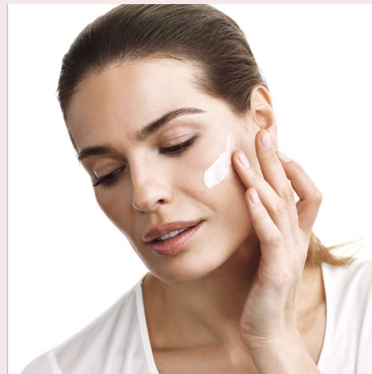
ШАГ 4: УВЛАЖНЕНИЕ Восстановление и защита

*Клинически доказанный результат при использовании комплексного ухода в равнении либо с кожей, для которой не использовался уход, либо использовались отдельные средства – для серий NovAge TSKinergize, Time Restore, Ecollagen Wrinkle Power и Ultimate Lift.