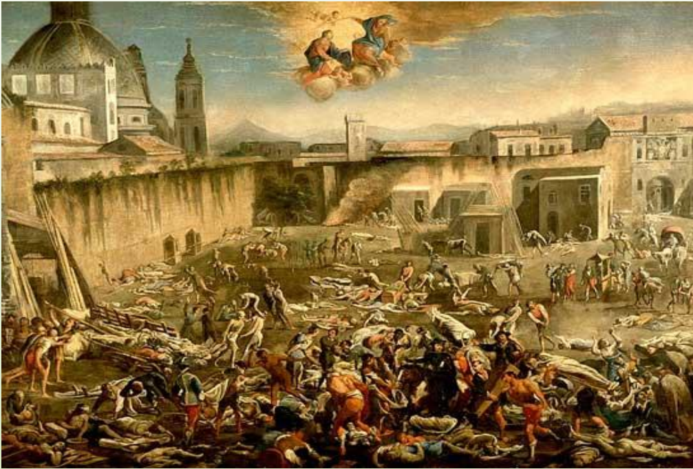
КАРТИНА ЧУМА В НЕАПОЛЕ В 1656 показывает опустошительное действие Черной Смерти (Музей Сан-Мартино, Неаполь.)

Эпидемия - это массовое, прогрессирующее во времени и пространстве в пределах определенного региона распространение инфекционной болезни людей, значительно превышающее обычно регистрируемый на данной территории уровень заболеваемости.