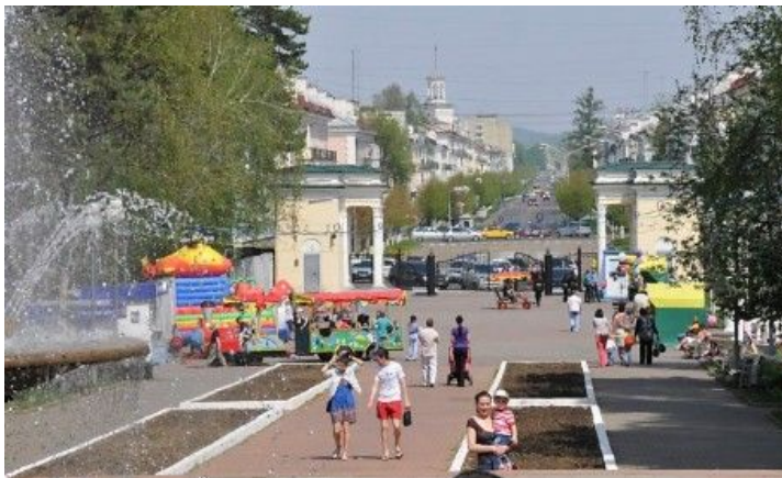
Парк культуры и отдыха им. Кирова

В городском парке можно увидеть множество аттракционов, различных интересных зон, спорт. развлечения и прочие