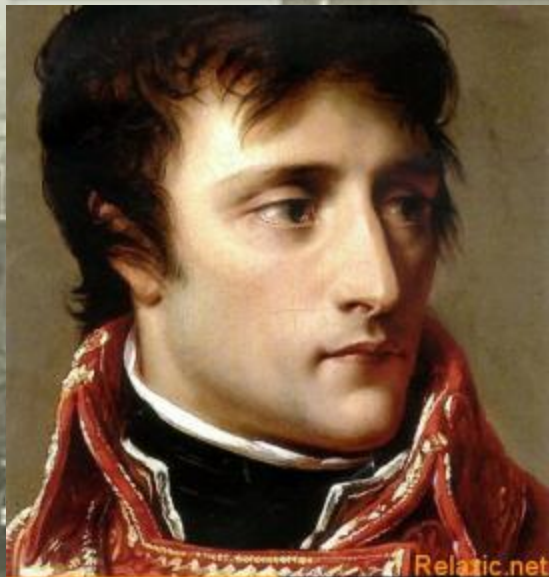
1 консул Наполеон Бонапарт