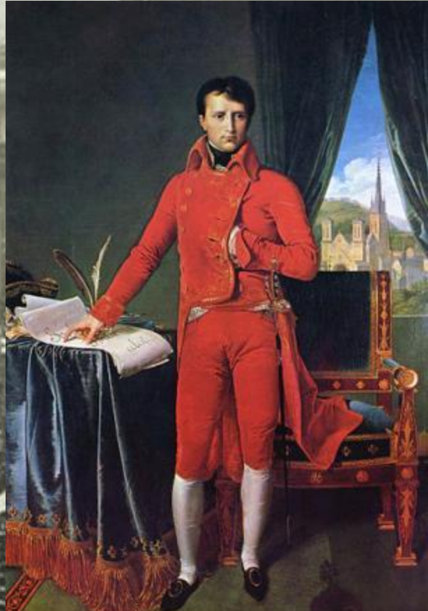
Первый консул – Бонапарт

В годы его консульства резко ограничилась законодательная власть, уничтожено местное самоуправление, в департаменты были направлены префекты – помощники консула.