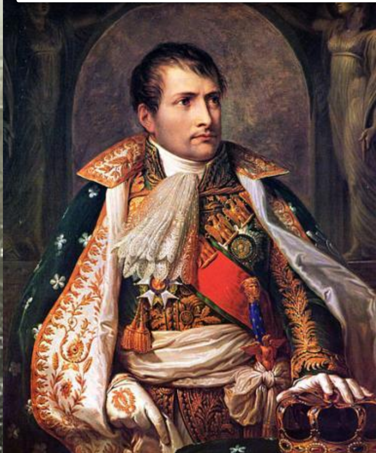
Первый император – Бонапарт

Для укрепления престижа верующих Бонапарт пошёл на переговоры с папой римским. Католическая церковь объявлялась религией всех французов. В 1805 г. Наполеон был коронован в Милане в Домском соборе.