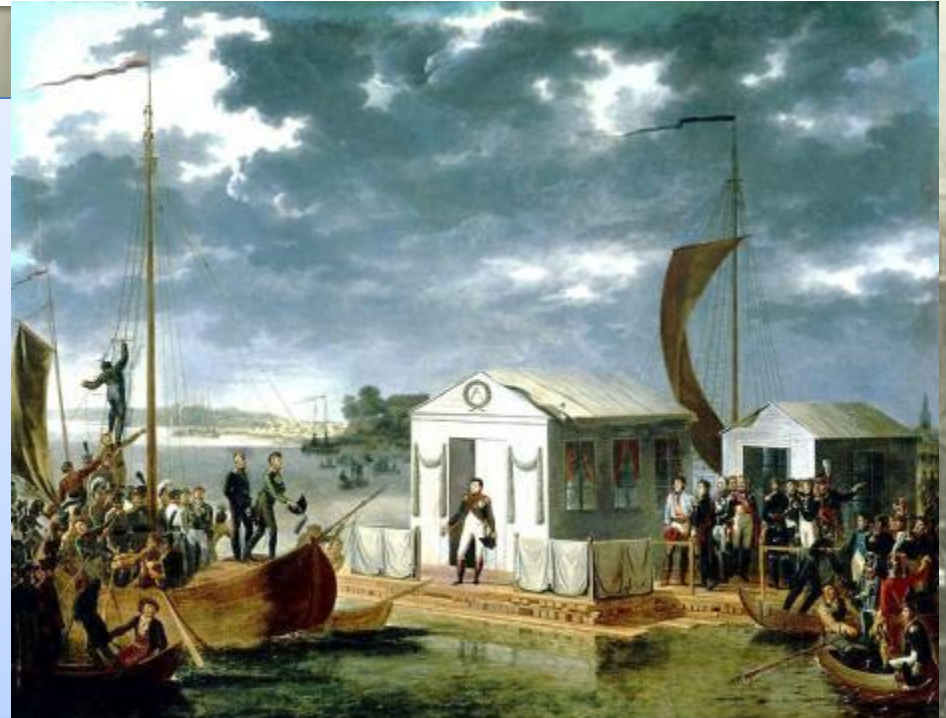
Встреча императоров в Тильзите

В 1807 году Наполеон заключил мир с Россией. Два императора встретились в Тильзите . На плоту они обменялись рукопожатиями и подписали мирный договор.