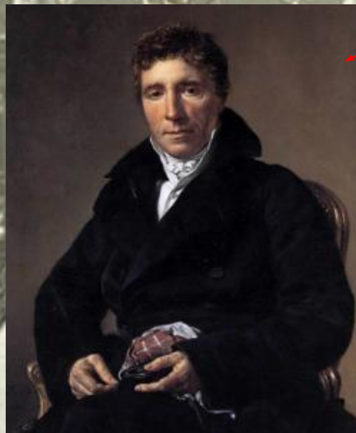
2 консул Эммануэль – Жозеф Сийес