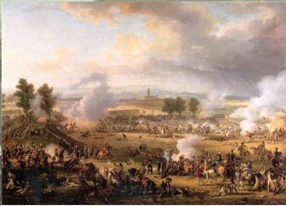
Битва при Маренго

В 1800 году Наполеон вместе со своей армией перешли через Альпы, зашли в тыл к австрийцам и одержали победу в битве при Маренго. Франция получила Пьемонт и Геную.