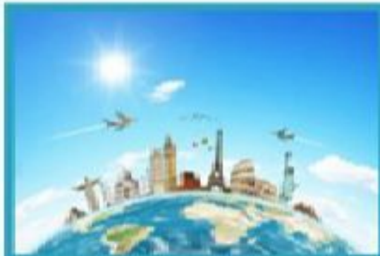
Әлем бойынша саяхат