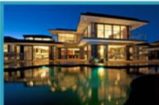
Әдемі үлкен үйіңіз