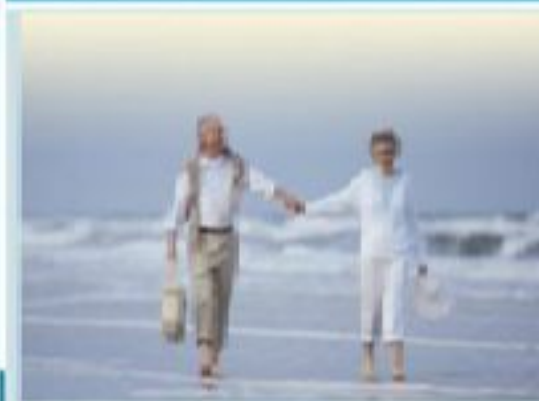
Бақытты көрілік шақ