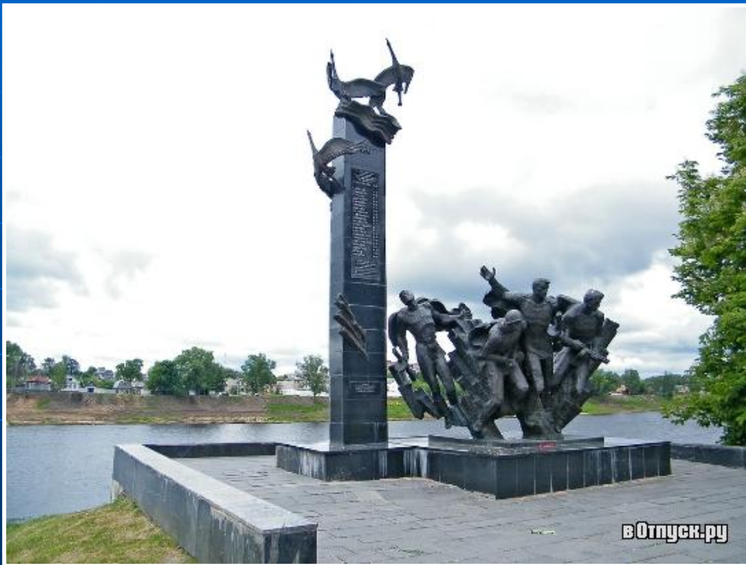
Памятник «Журавли» Полоцк. Белоруссия