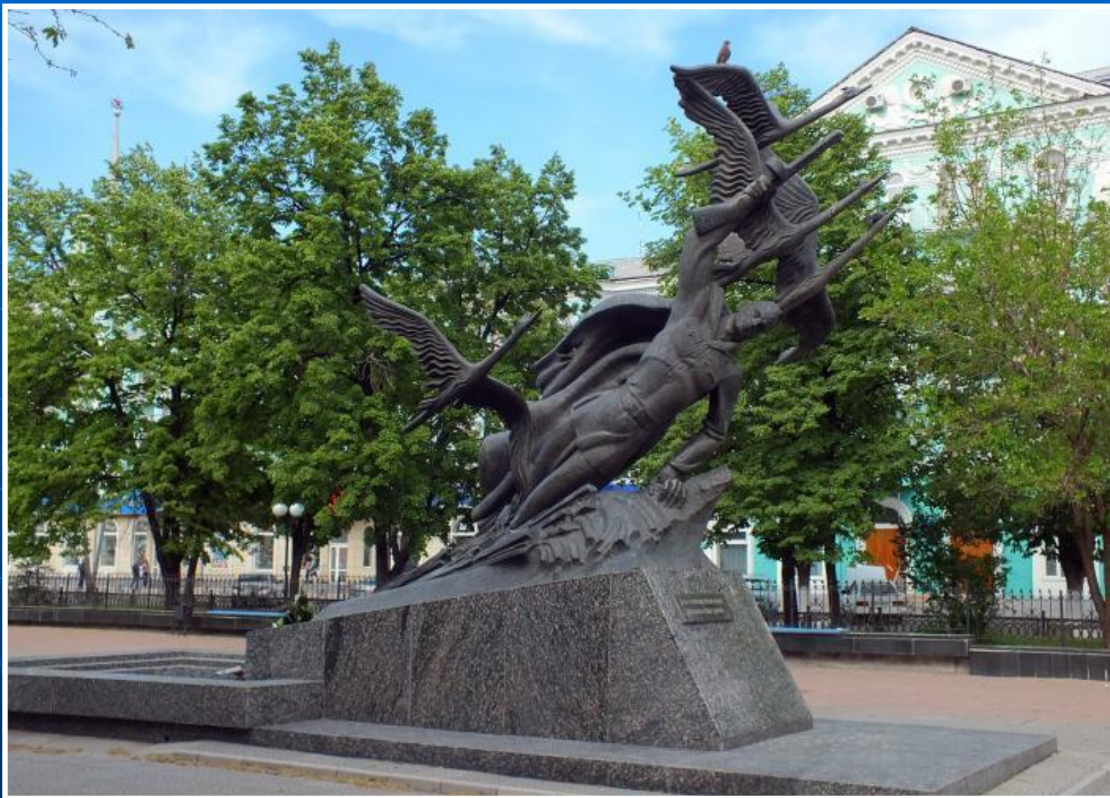
Памятник «Журавли» Луганск. Украина