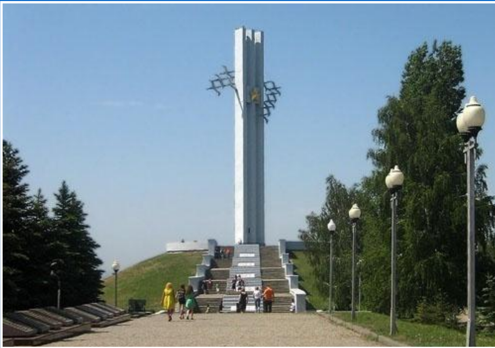
Памятник «Журавли» Саратов. Россия