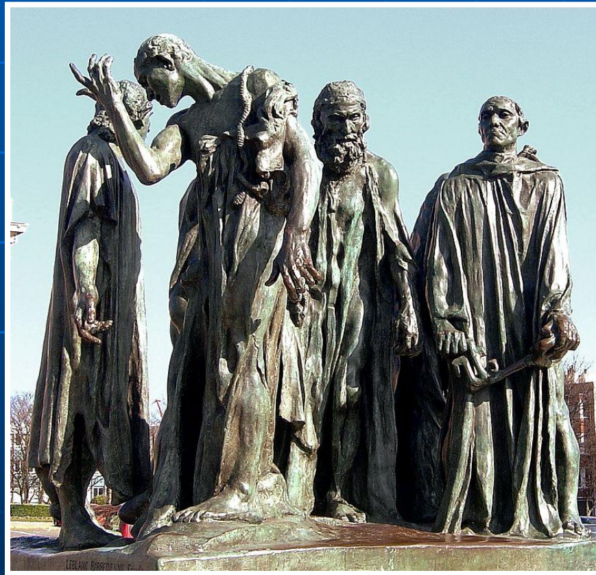
«Граждане Кале» Огюст Роден

И сколько бы лет ни прошло, в памяти народа будут хранится мужество и отвага воинов, стойкость и вера матерей, радость побед и печаль поражений.