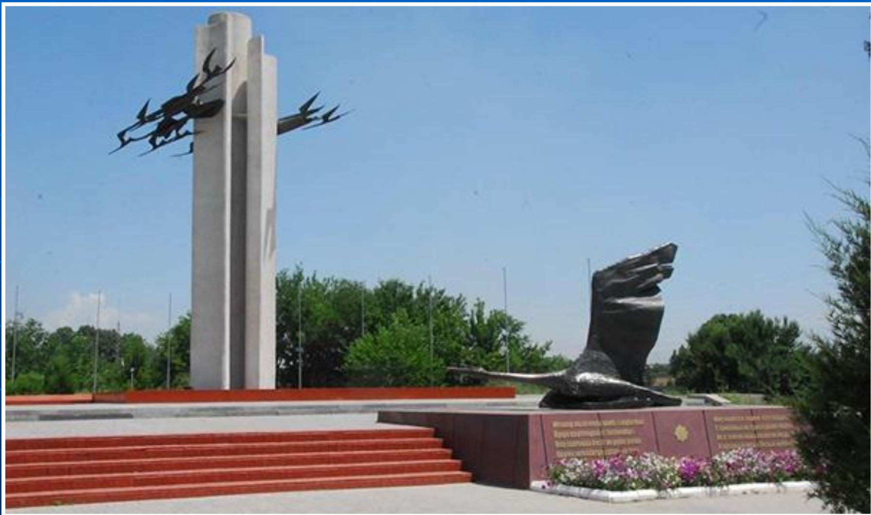
Памятник «Журавли» Чирчик. Узбекистан