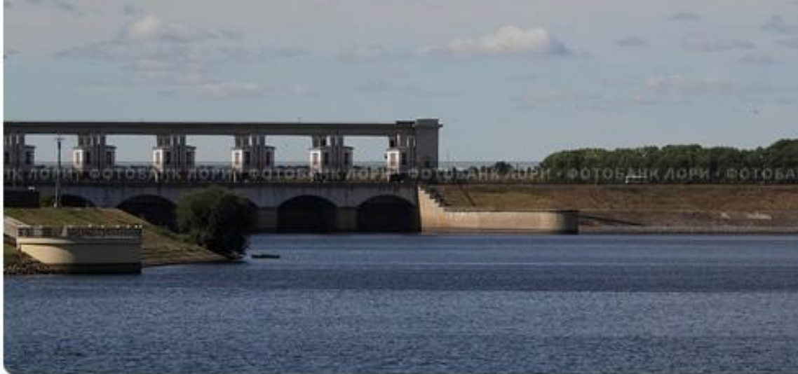
Плотина на реке Волга в районе города Углич