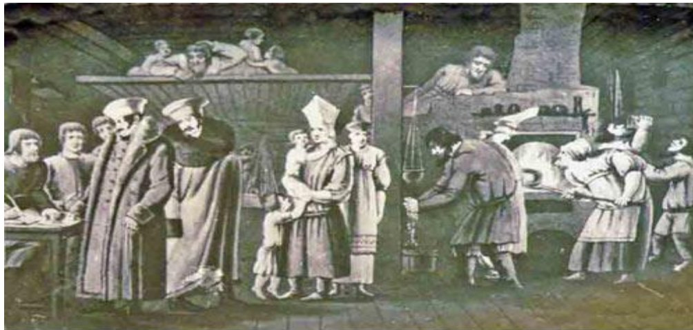
Ямская изба XVII века (рисунки неизвестного художника).

Согласно сообщению того же автора, в начале XVII века ямы (почтовые станции) располагались друг от друга на расстоянии от 6 до 20 миль (30-100 км). При этом, путешественники разных сословий, исполняющие волю Великого князя, могли менять на ямах разное количество лошадей: «простой человек мог взять лишь одного коня; сын боярского сына — три; а которому на подорожной от Великого князя напишут с „вич“, например — Борис Васильевич, тому шесть. Сыну с отчеством, то есть какого-нибудь большого думного — 15, думному князю — 30».