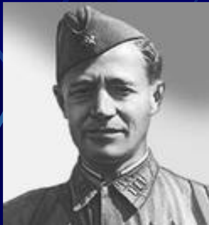
Поэт А.Сурков 1899-1983г.