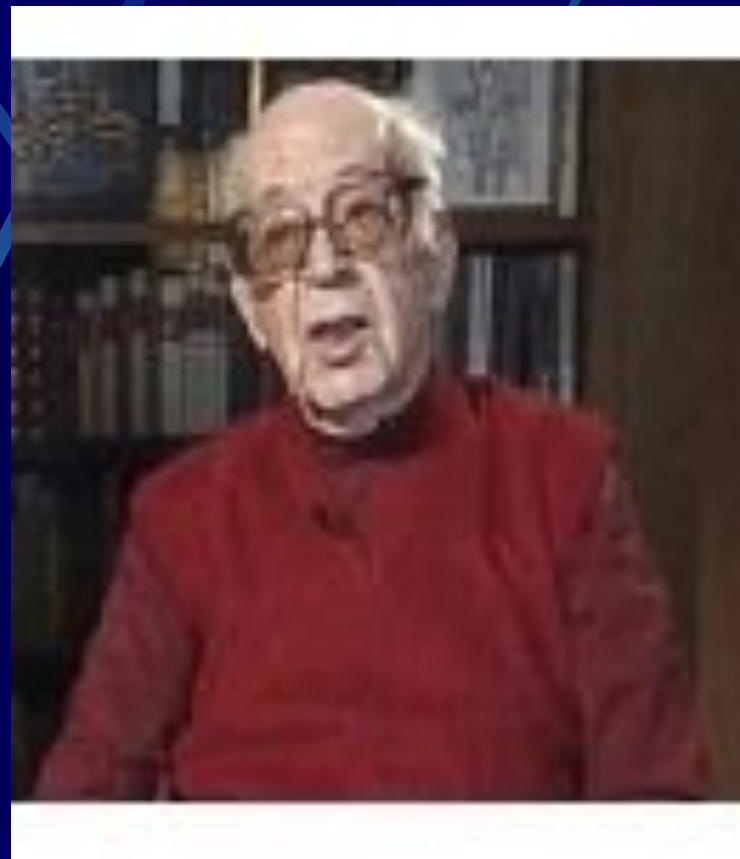
Композитор Н. Богословский 1935г.