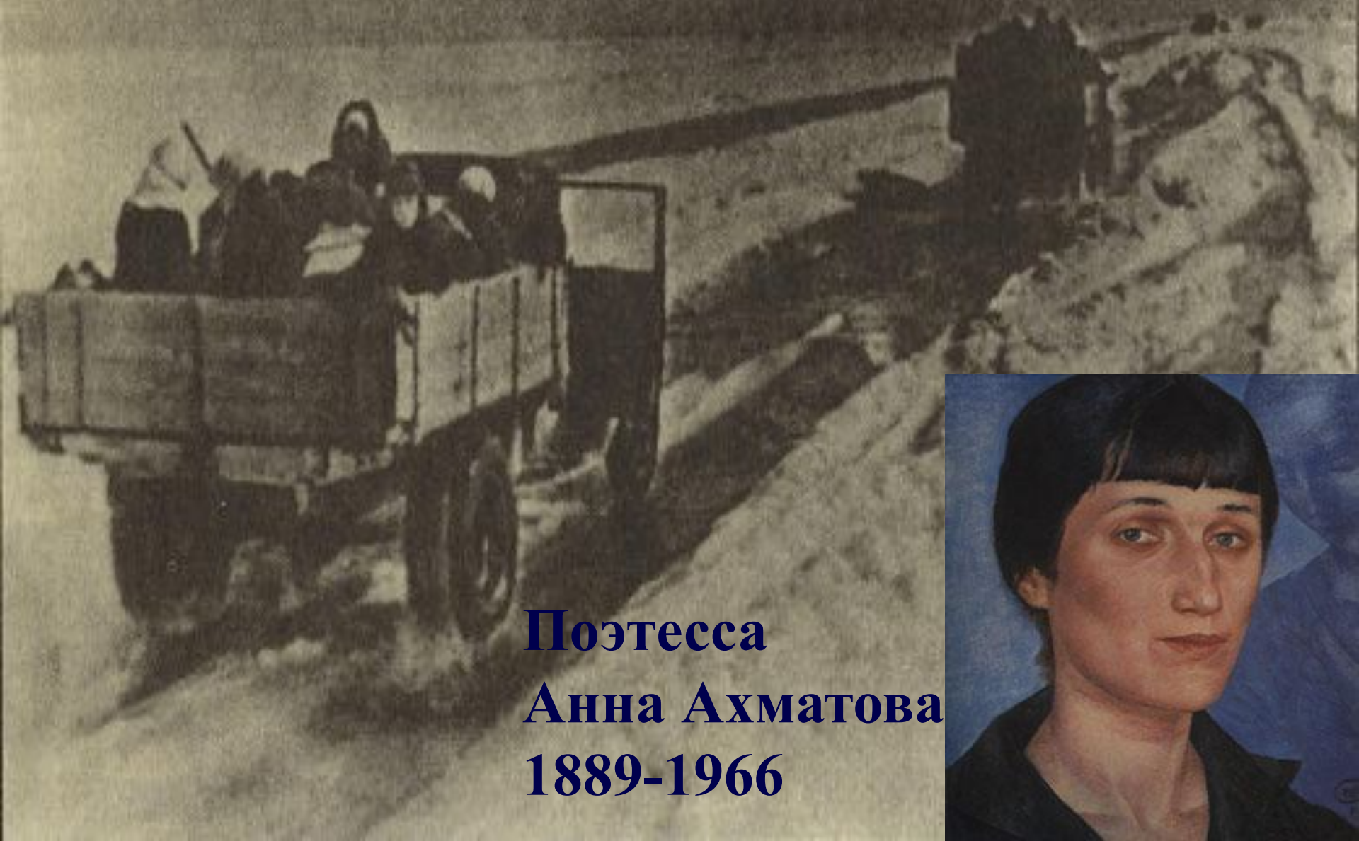
Поэтесса Анна Ахматова 1889-1966