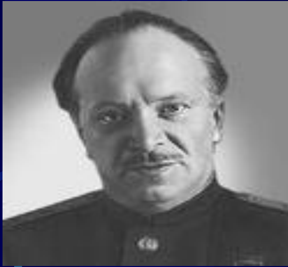
поэт В.Лебедев-Кумач 1898-1949