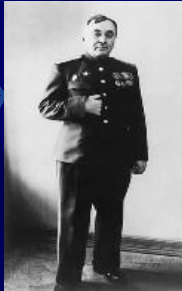
Композитор А.В. Александров 1883- 1946