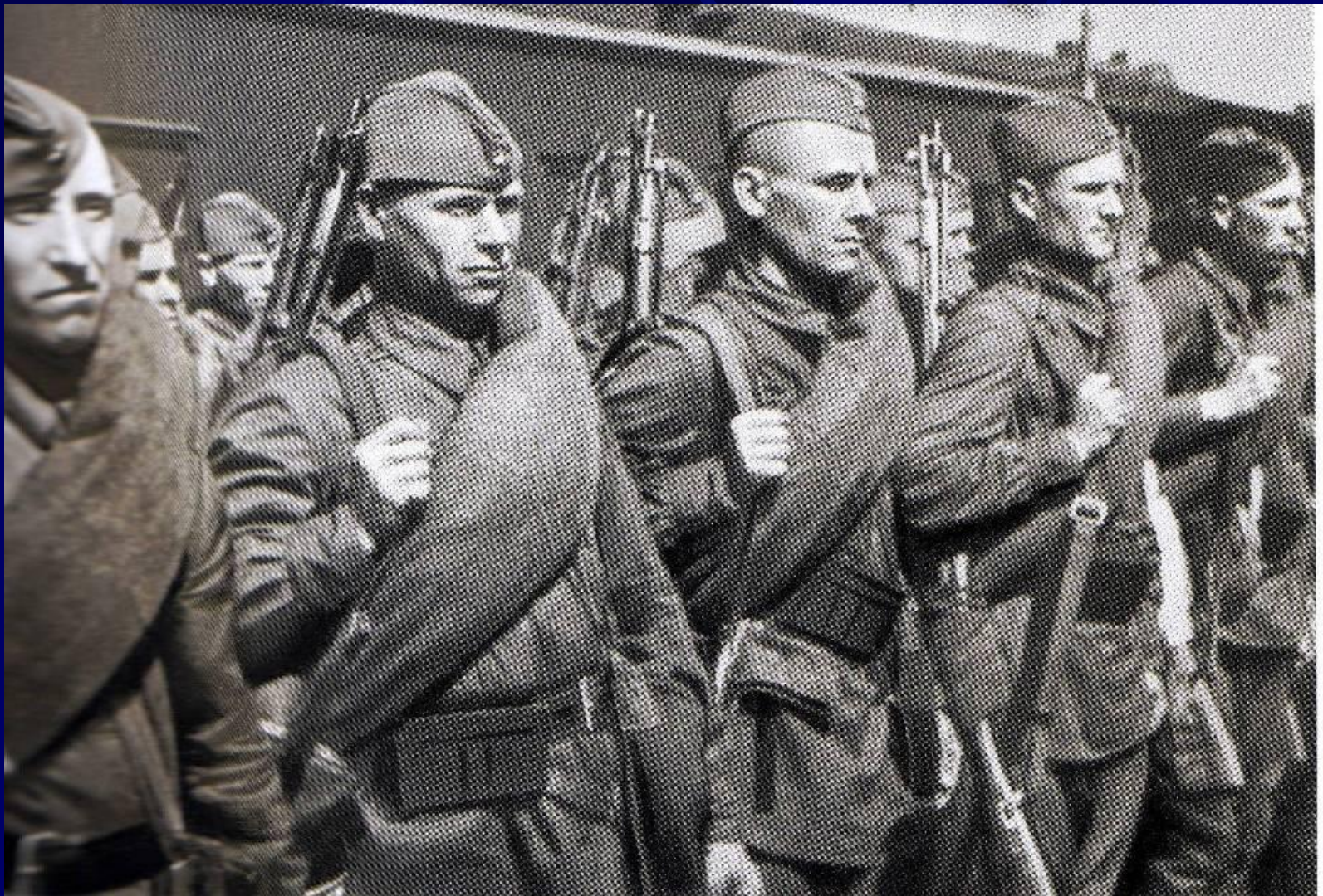
Москва, Белорусский вокзал июль 1941 года Эшелоны с бойцами уходят на фронт