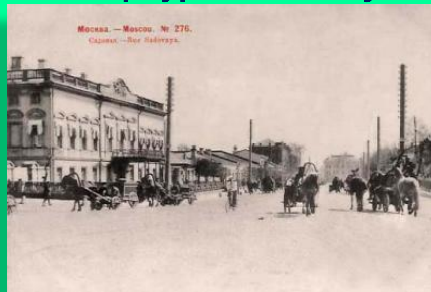
Москва, Садовое кольцо, 1903.

В 1911 по инициативе Вересаева было создано «Книгоиздательство писателей в Москве», которое он возглавлял до 1918. В эти годы выступал с литературоведческими и критическими исследованиями.