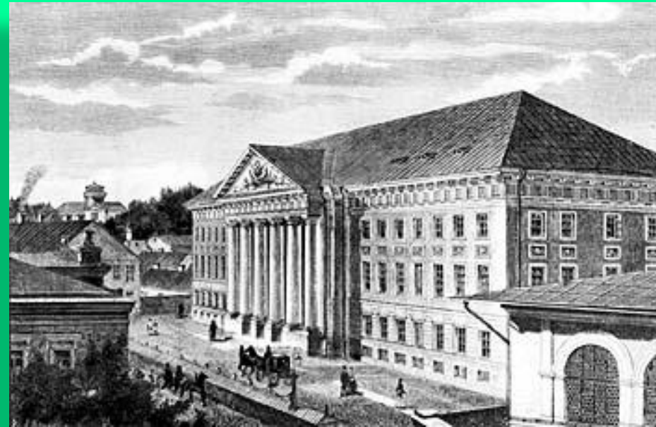
Дерптский университет в Туле