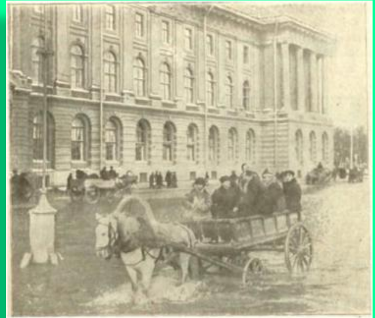
Улица Петербурга во время наводнения 1903.

В 1901 был уволен из Барачной больницы по предписанию градоначальника и выслан из Петербурга. Два года прожил в Туле. Когда срок высылки закончился, переехал в Москву.