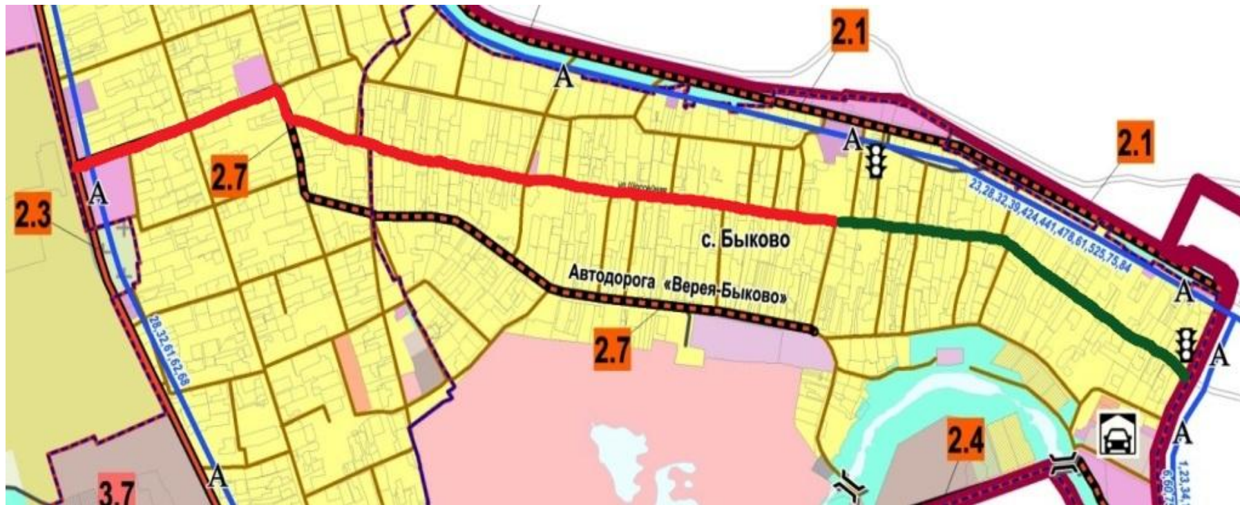
Схема прохождения автомобильной дороги общего пользования регионального значения «Верея – Быково» по территории с.п. Верейское