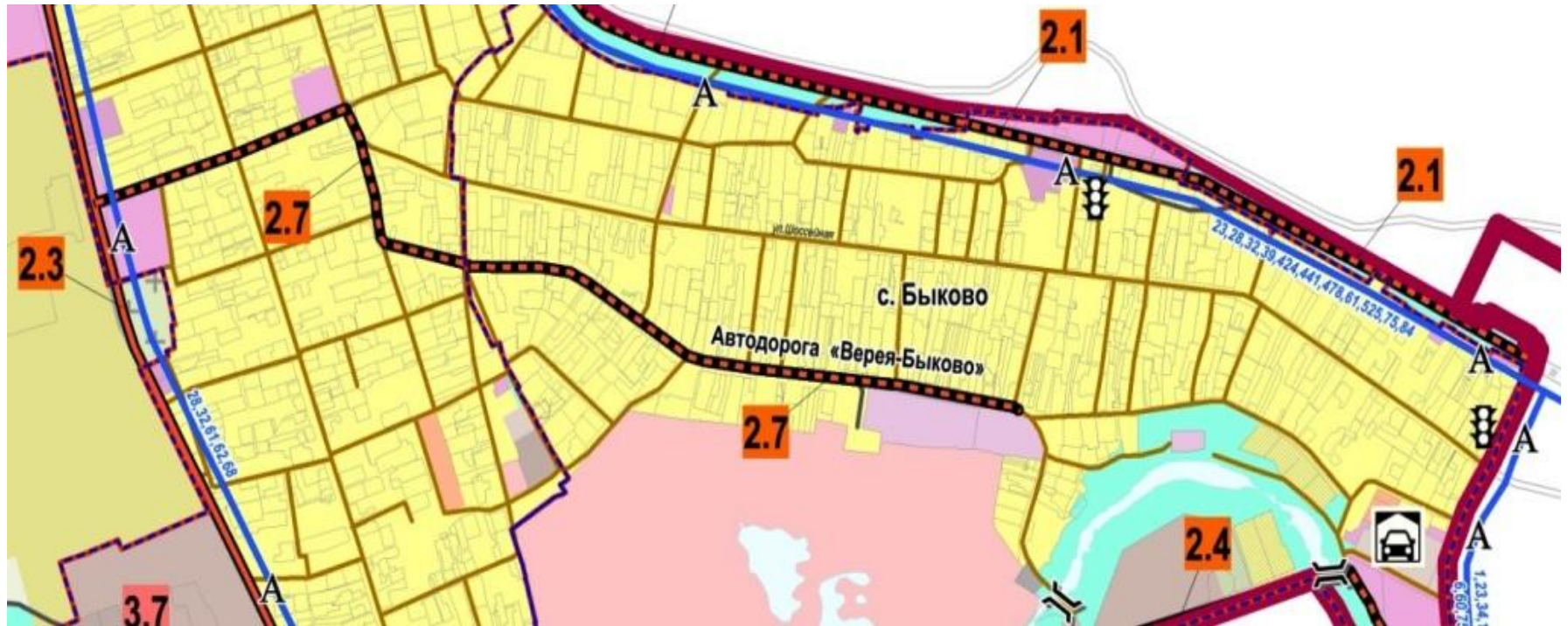
Таблица № 2.5.1 том 1 проекта Генплана с.п. Верейское

Карта транспортной инфраструктуры с.п. Верейское