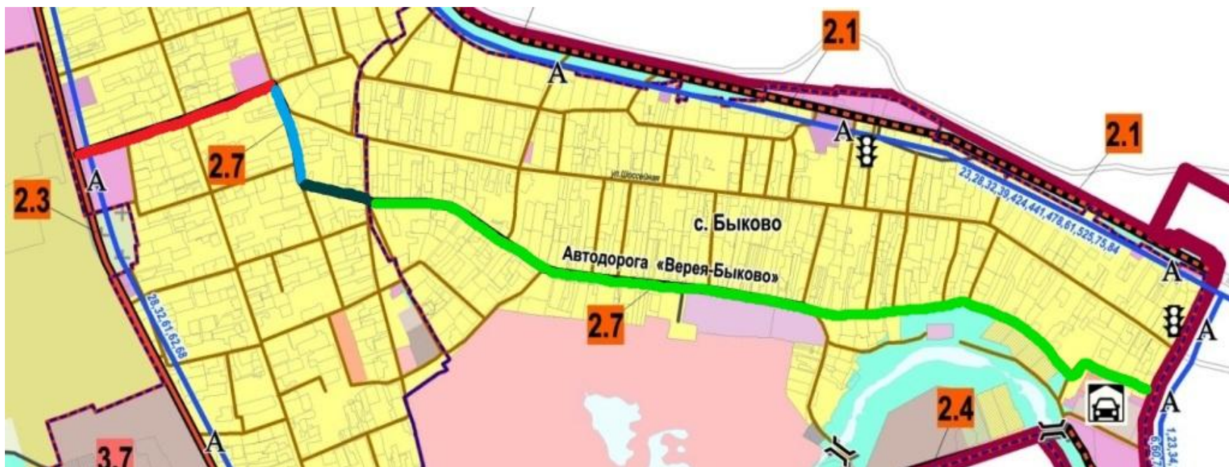
Схема автомобильных дорог регионального и местного значения проходящих по территории с.п. Верейское