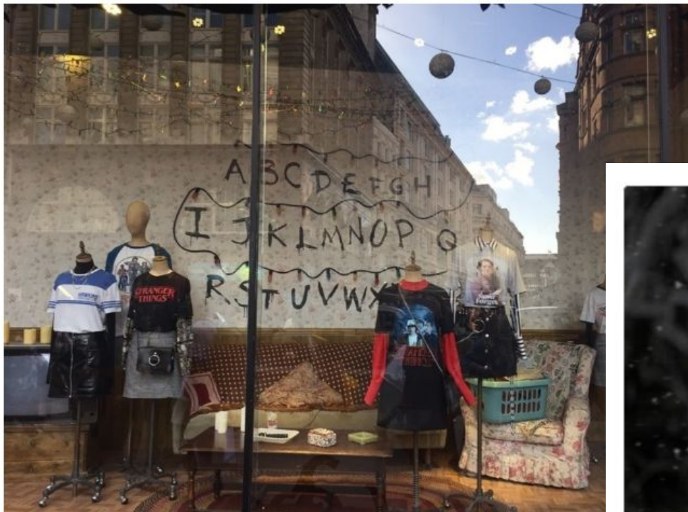
Витрина флагманского магазина Topshop