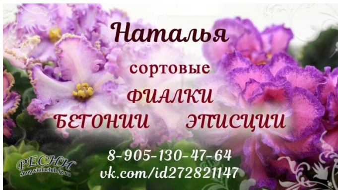
Макет личной визитки