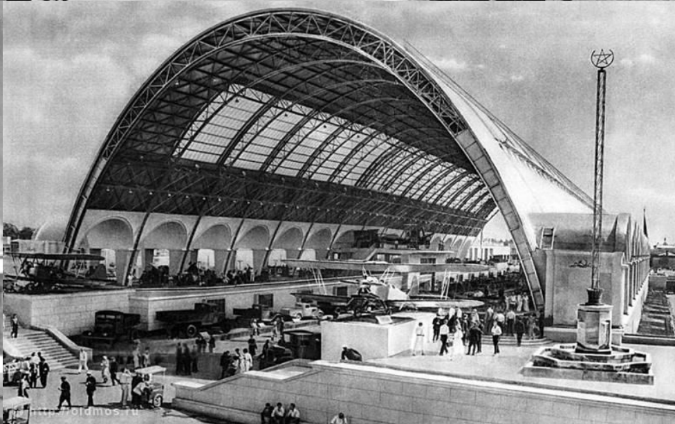
КОМПЛЕКС ПАВИЛЬОНОВ ВСХВ