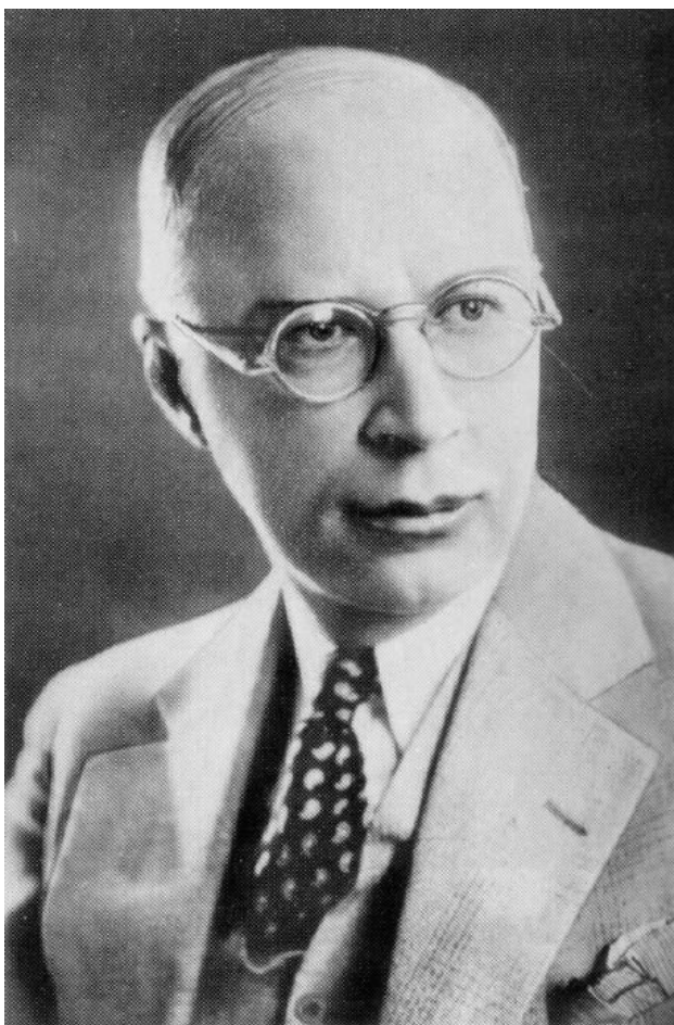
Сергей Сергеевич Прокофьев