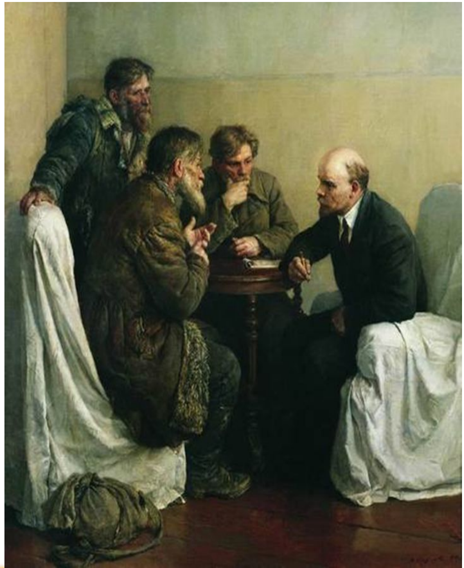
В. А. Серов. «Ходоки у Ленина»