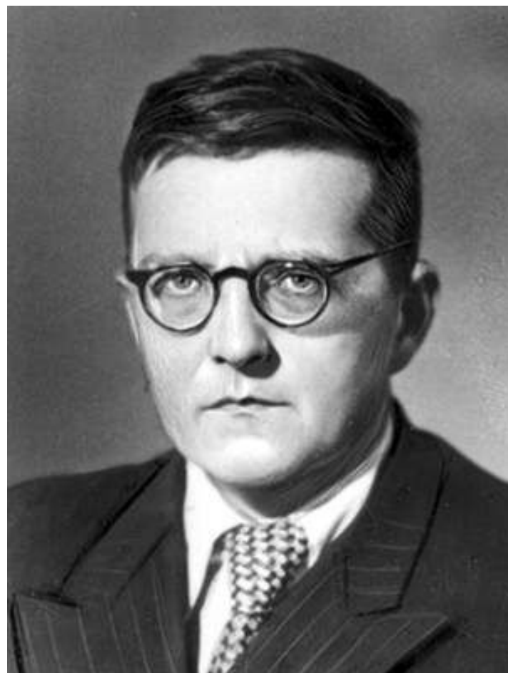
Дмитрий Дмитриевич Шостакович