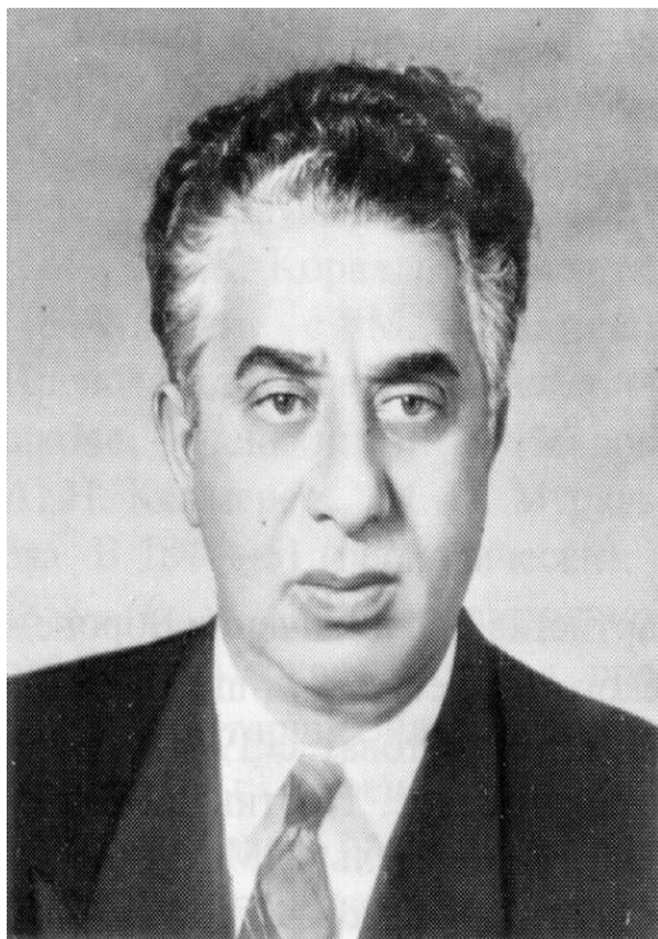
Арам Ильич Хачатурян