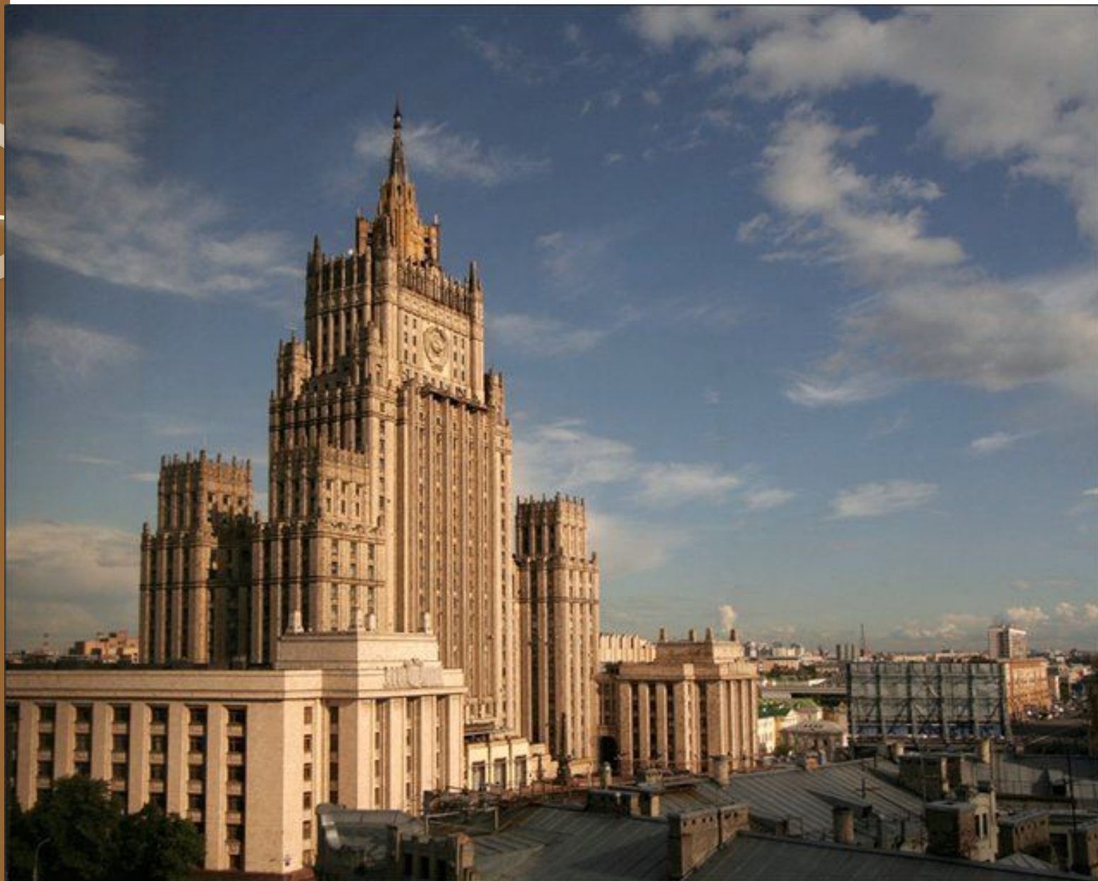
здание МИД СССР на Смоленской-Сенной площади.