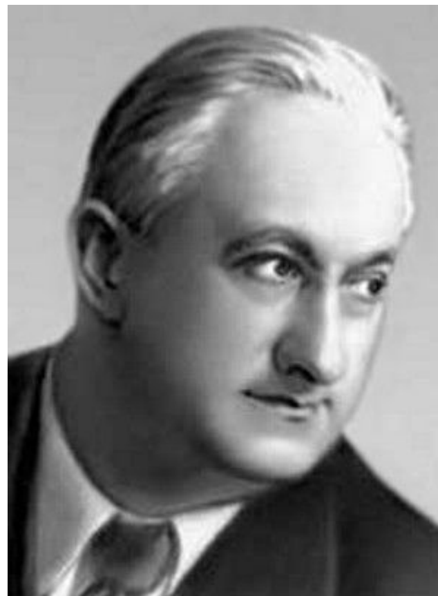
Вано Ильич Мурадели