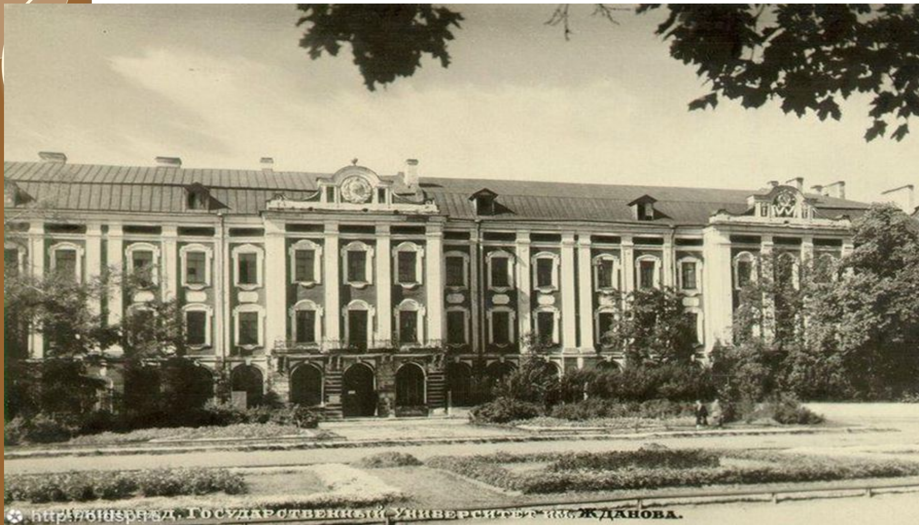
Санкт-Петербургский государственный университет, носящий в те дни название ЛГУ им. Жданова