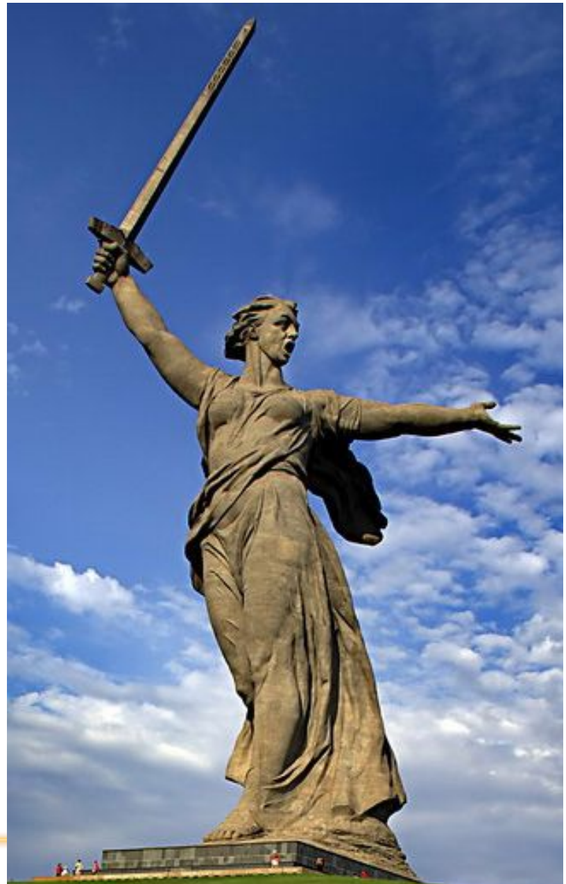
Монумент «Родина-Мать зовет!» (Волгоград)