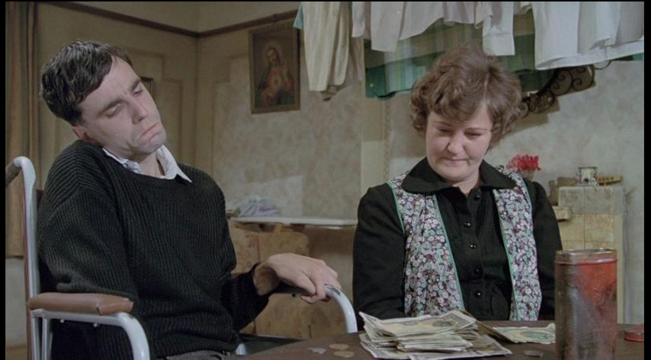
Иллюстрация: Дэниел Дэй-Льюис и Бренда Фрикер в фильме «Моя левая нога» (1989)

Экранизация фильма «Моя левая нога» была выполнена режиссёром Джимом Шериданом по сценарию Шейна Коннотона в 1989 году. Дэниел Дэй-Льюис снялся в роли Кристи Брауна, а Бренда Фрикер исполнила роль его матери. Актёры выиграли премию «Оскар» за свои роли. Фильм также выдвигался на премию в номинациях «Лучший фильм года», «Лучшая режиссура», а также «Лучший адаптированный сценарий». Дэниел Дэй-Льюис, готовясь к съёмкам, проводил время в школьной клинике Сандимаунт Дублина, проникаясь жизнью людей с ограниченными возможностями.