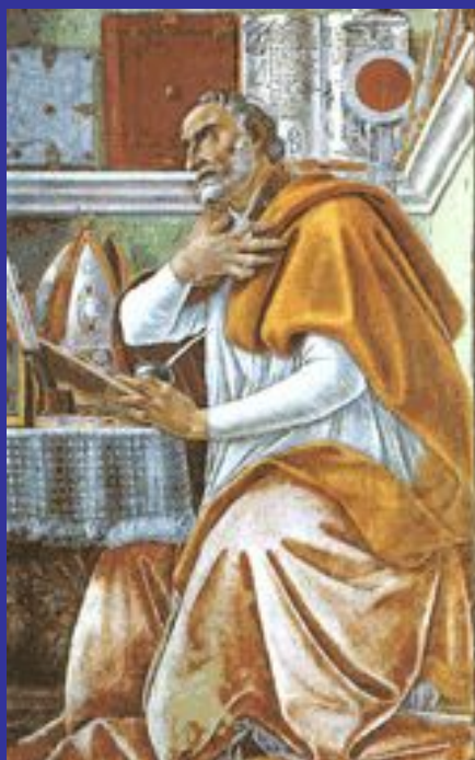
Сандро Боттичелли «Блаженный Августин в келье»