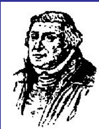
Мартин ЛЮТЕР (1483-1546)