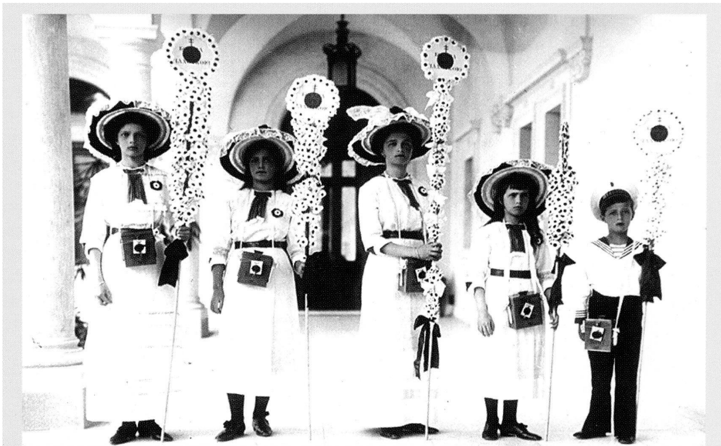
Дети Императора Николая II в День Белого цветка: Татьяна, Мария, Ольга, Анастасия, Алексей. Ливадия, 20 апреля 1912 г.

В Ливадийском имении с разрешения родителей белую ромашку продавали цесаревич и великие княжны