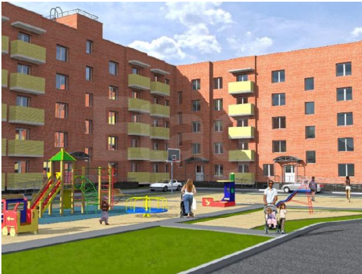
Новостройки - ул. Парковая