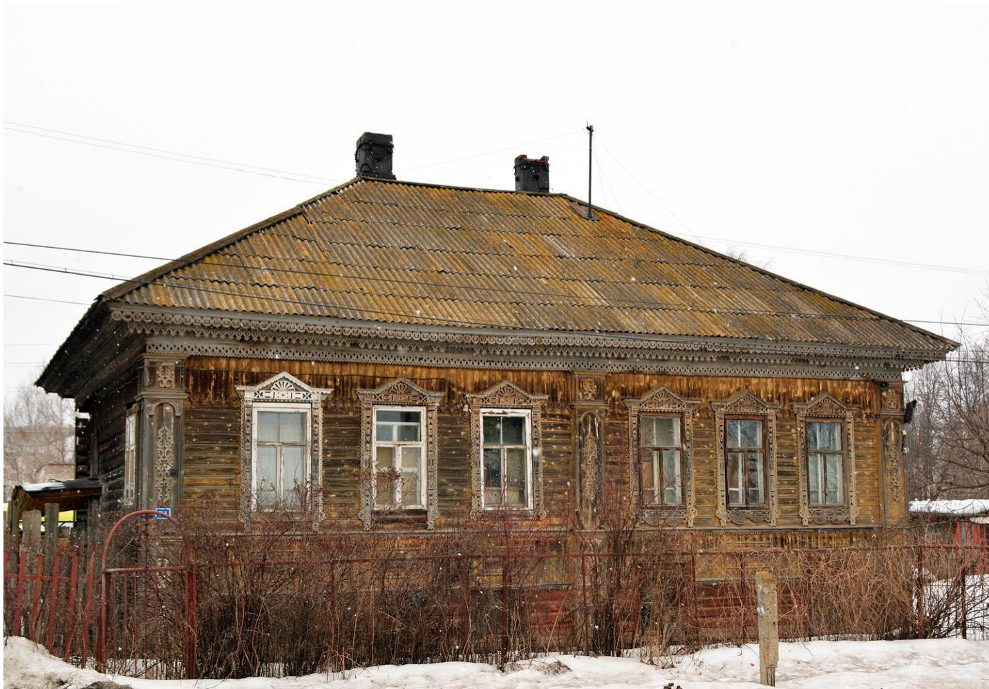
Дом на ул. Р.Кашина