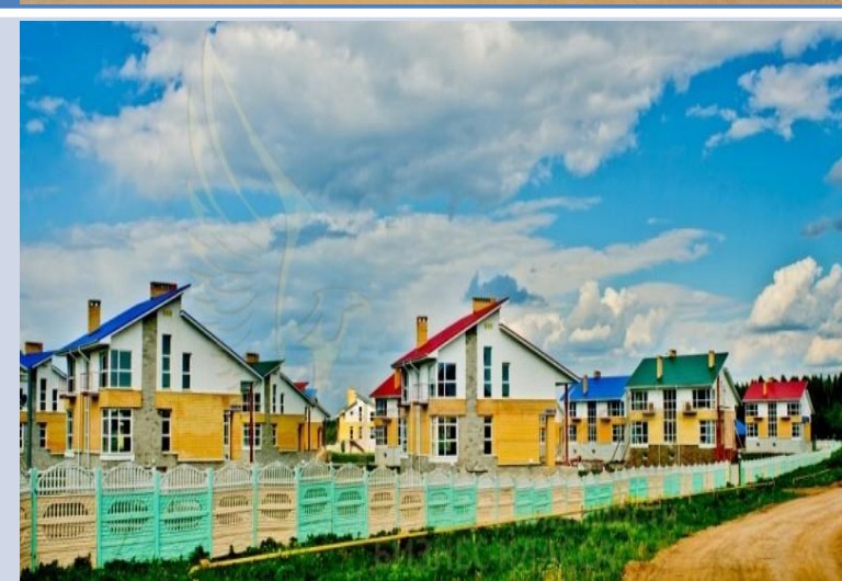
Новостройки «Южная Усадьба»