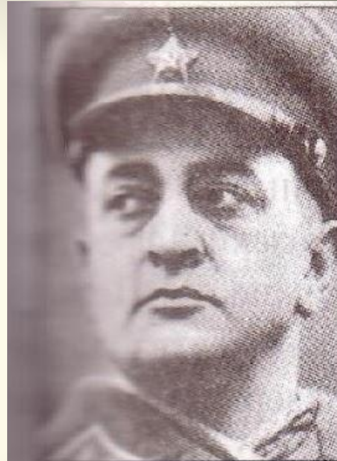
М. Н. Тухачевский