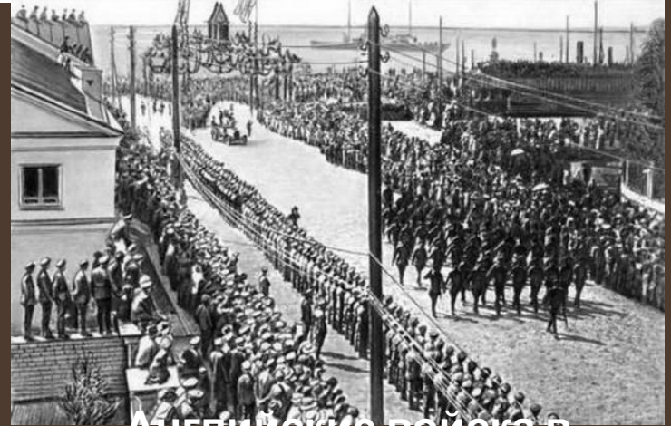
Английские войска в Архангельске