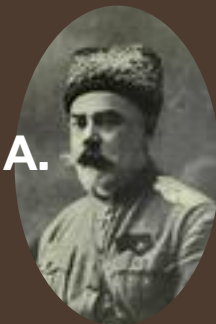
Деникин А. И.