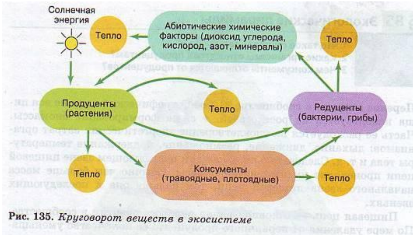
Рис. 135. Круговорот веществ в экосистеме