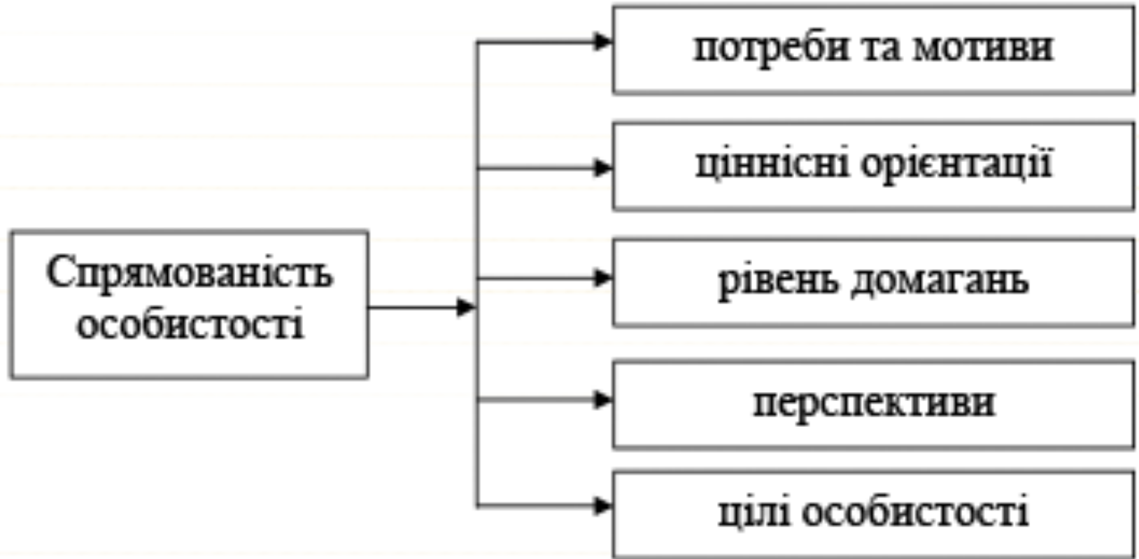
Рис. 2. Психологічні компоненти, які впливають на спрямованість особистості

Головним структурним компонентом особистості є її спрямованість як система спонукань, що визначає вибірковість ставлень та активності особистості.