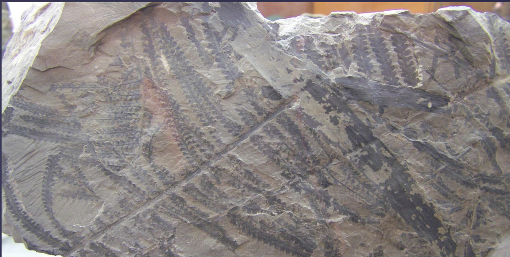
Отпечаток ископаемого папоротника