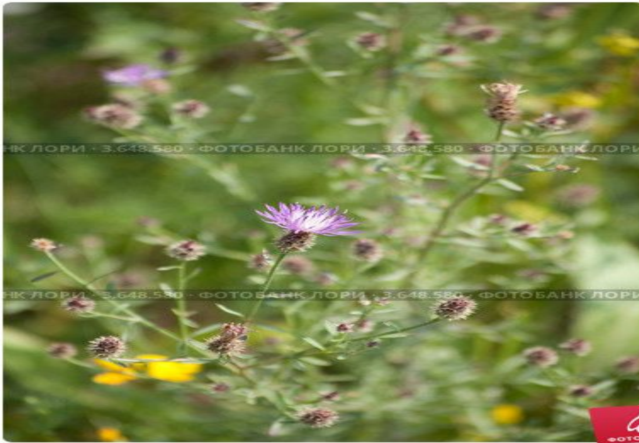
Василек ложнобледночешуйчатый, Centaurea pseudoleucolepis