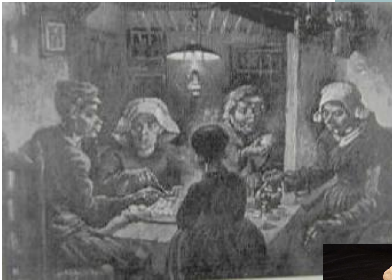
Ван Гог “Едоки картофеля”