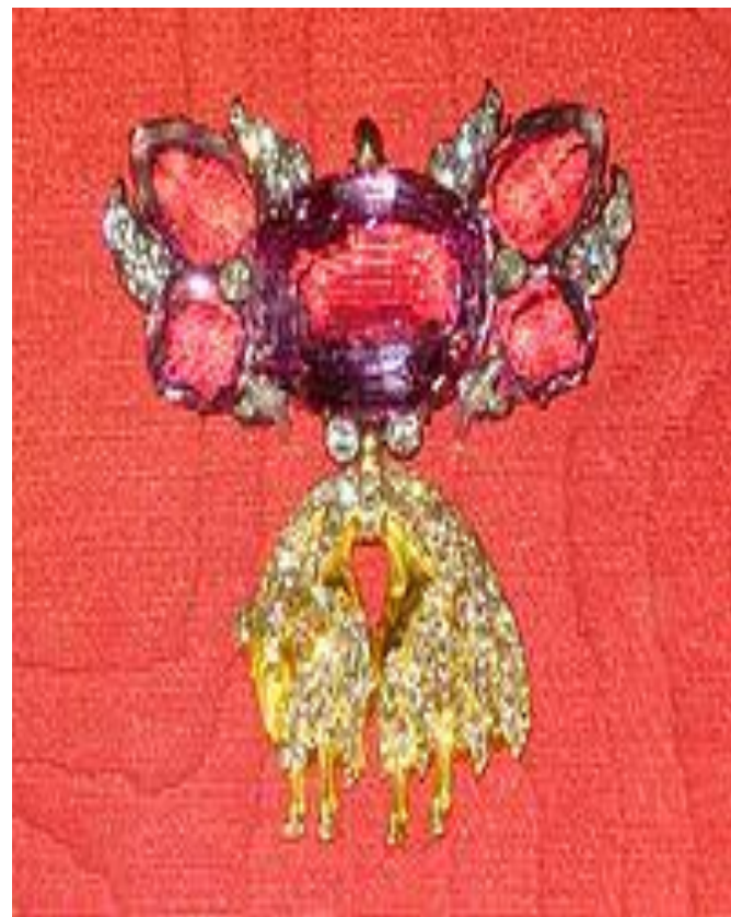
Орден Золотого руна - один из экспонатов

Алмазный фонд Российской Федерации — составная часть Государственного фонда драгоценных металлов и драгоценных камней Российской Федерации , представляющая собой собрание уникальных самородков драгоценных металлов и уникальных драгоценных камней , имеющих историческое и художественное значение, а также собрание уникальных ювелирных и иных изделий из драгоценных металлов и драгоценных камней.