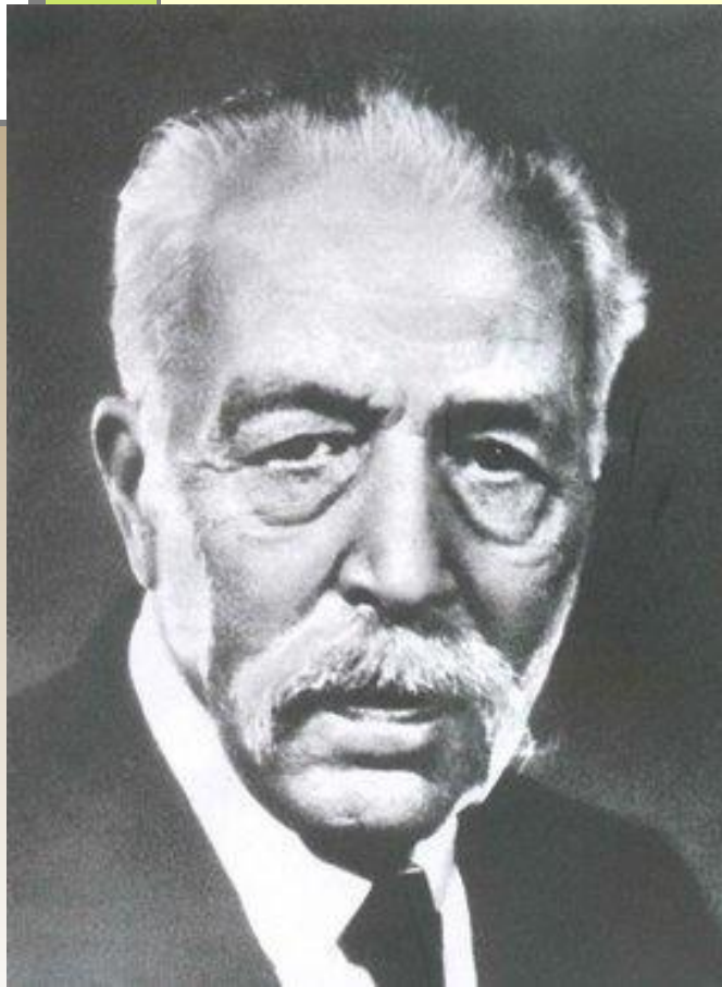
Гаэтано Моска (1858 -1941), итальянский юрист, социолог

Моска Г. пытался доказать неизбежное деление любого общества на две неравные по социальному положению и роли группы.