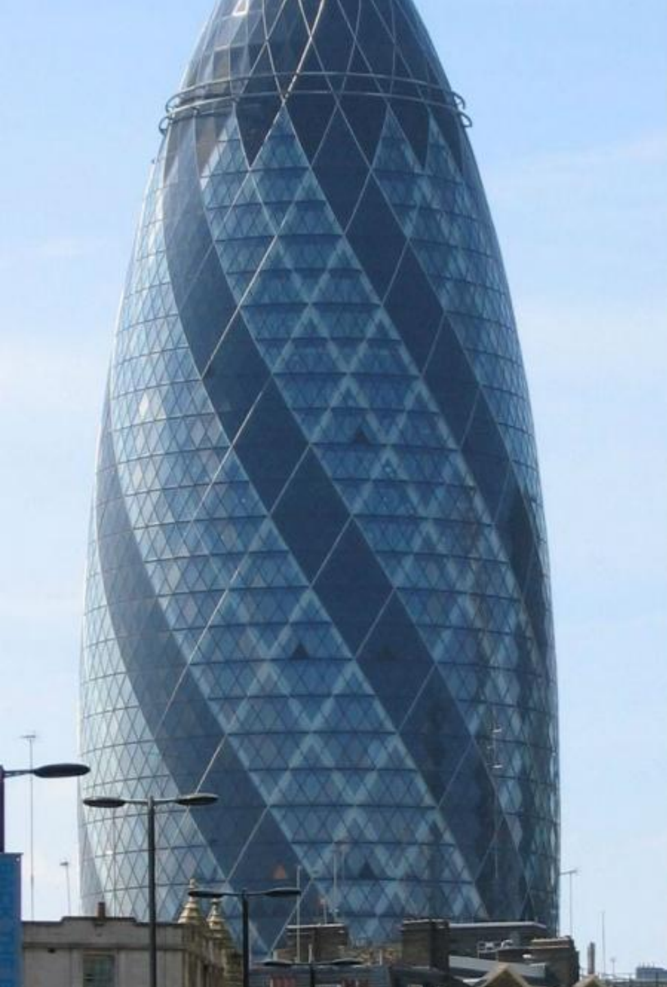
Небоскреб 30 St. Mary Axe в Лондоне