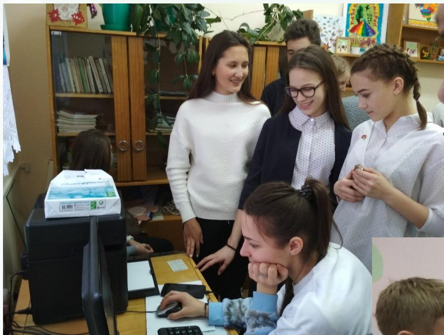
Работа в программе «Дизайн интерьера 3D»