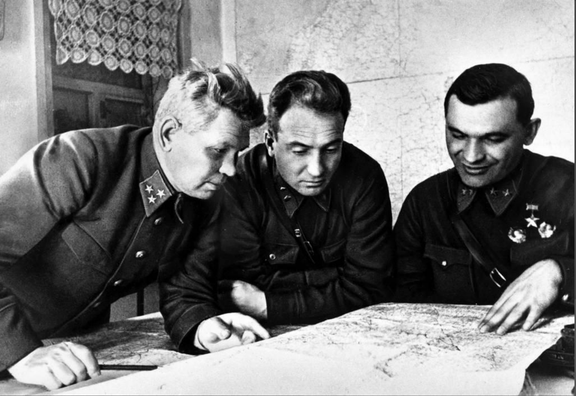
Прокуратура в военное время