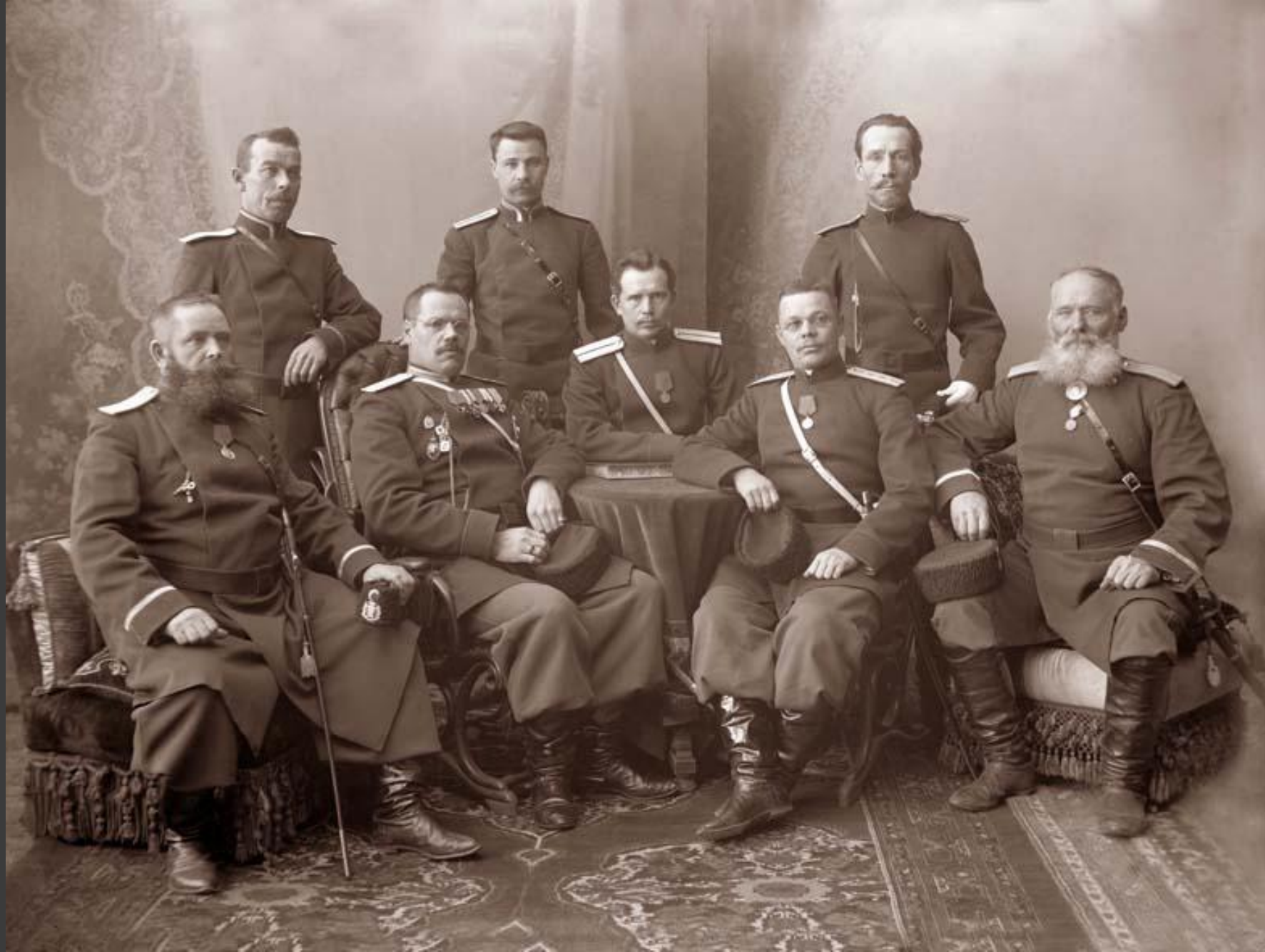
Прокуроры в XVIII в.