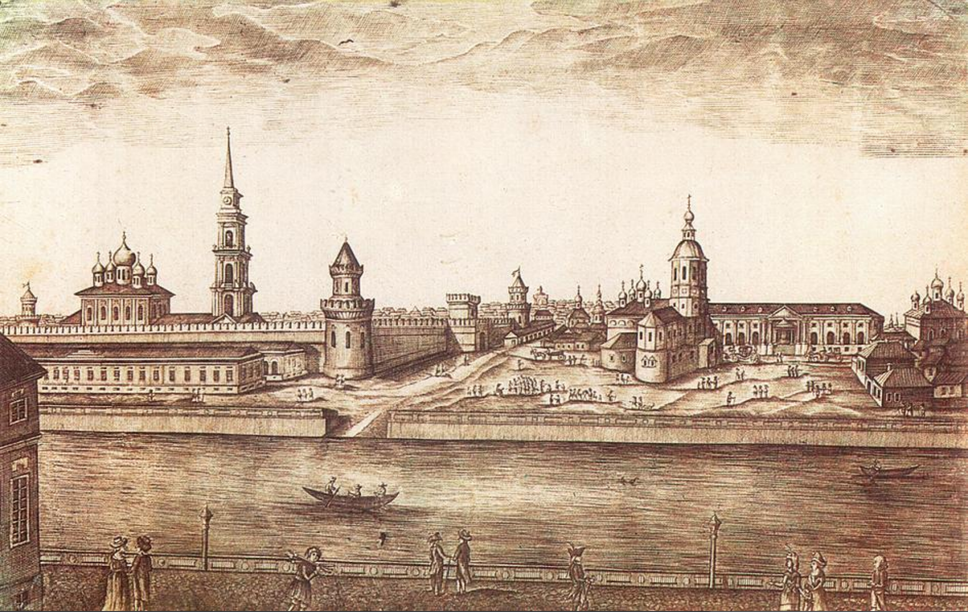
Тула в XVIII в.