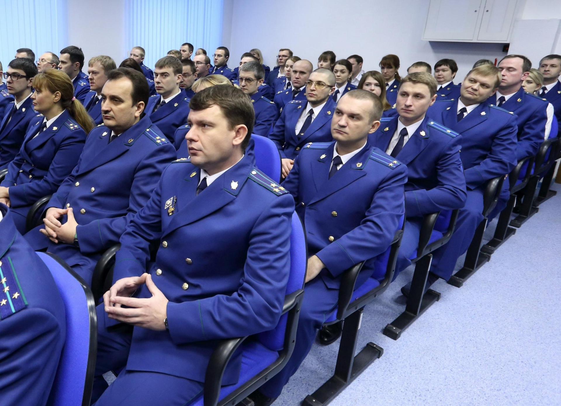
Прокуроры в наши дни