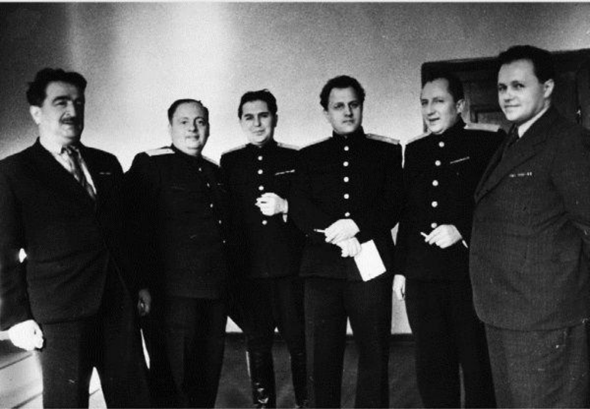
Прокуроры начала ЛЛ в. (СССР)