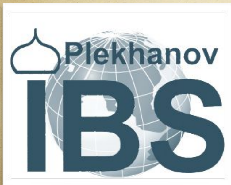
Факультет" международн ая школа бизнеса и мировая экономика"