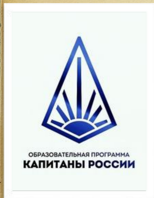
Институт управления и социально- экономического проектирования