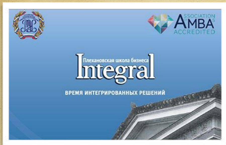
Факультет "Плехановская школа бизнеса "Integral"