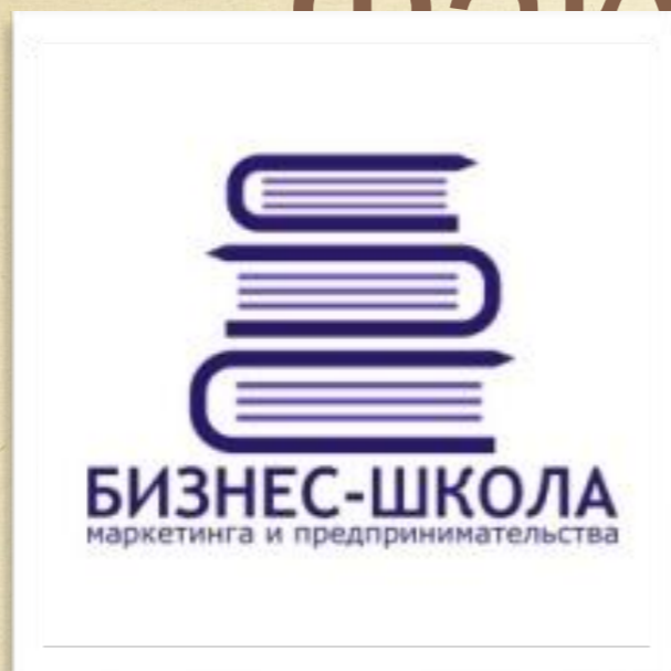
Факультет "Бизнес- школа маркетинга и предпринимательства