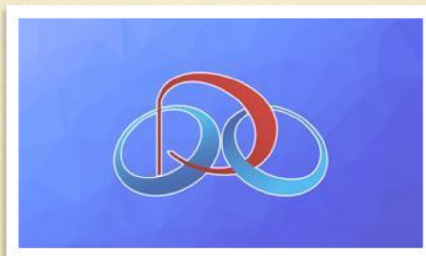
Факультет дистанционного обучения