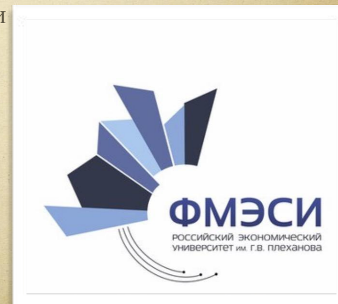
Факультет математической экономики, статистики и информатики