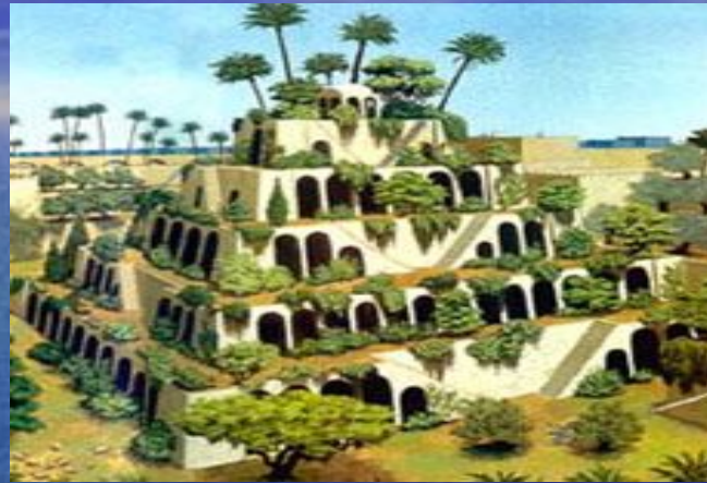
Висячие сады Семирамиды