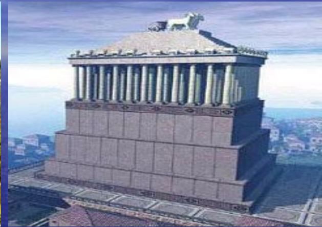
Мавзолей в Галикарнасе