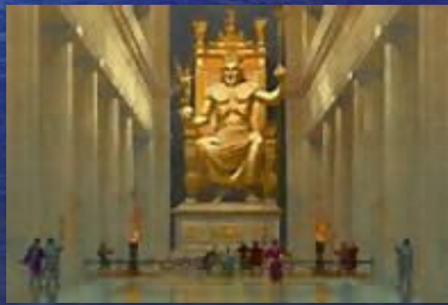
Статуя Зевса в Олимпии