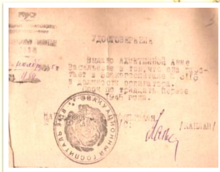
ГА в г.Красноуфимске. Ф.№ Р – 235. Оп. 1.Д. 10. Л. 3

До марта 1946 г. работала ординатором эвакогоспиталя №3118, откуда была переведена во вторую городскую поликлинику г. Красноармейска врачом уха, горла, носа.