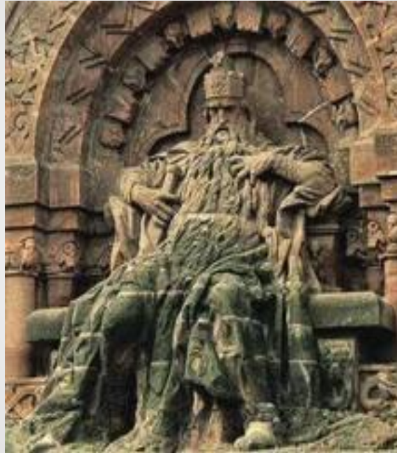
Otto von Bismarck