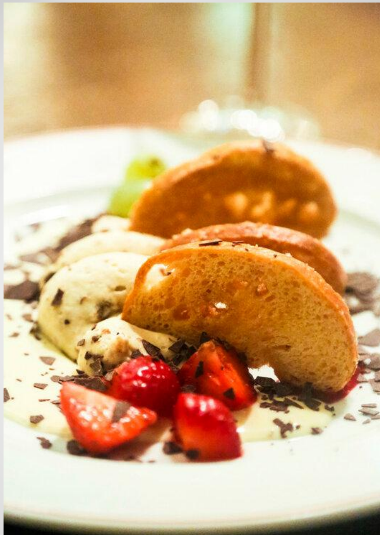
Pumpernickel - Roggenbrot